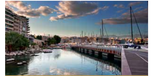
مارينا زياس التاريخية

نتج عن نكبة اسيا الصغرى في عام 1922 وتهجير اليونانيين من أسيا الصغرى إستقبال ميناء بيريه لعدد كبير من اللاجئين فتضاعف عدد السكان. إلا أن ما كان له أهمية أكبر أن وجود اللاجئين قد ساهم بدرجة جوهرية في تشكيل الصورة والطابع الحضاري للمدينة. كانت آخر مأساة عاشها بيريه هي الحرب العالمية الثانية، حين قصفت مراراً. كانت نهاية هذه الحرب بمثابة الإعلان عن إعادة إعمار المدينة وبالإضافة إلى أداء الملاحة التجارية اليونانية، التي أصبحت قوة عالمية بعد الحرب العالمية الثانية، تحول بيريه إلى أكبر ميناء في الشرق المتوسط.