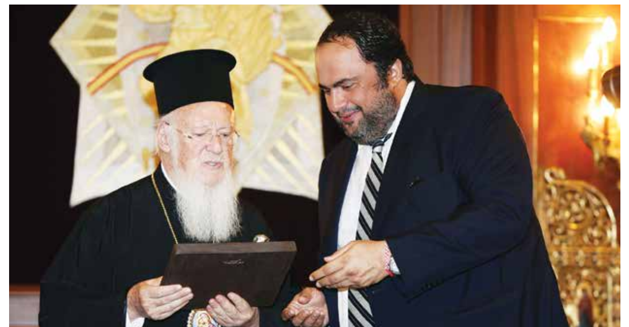
السيد ماريناكيس مع البطريرك المسكوني كيريوس كيريوس قارثلميو