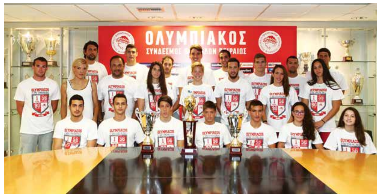
سباحة/بطل اليونان رجال وسيدات جماعي 2015-2016