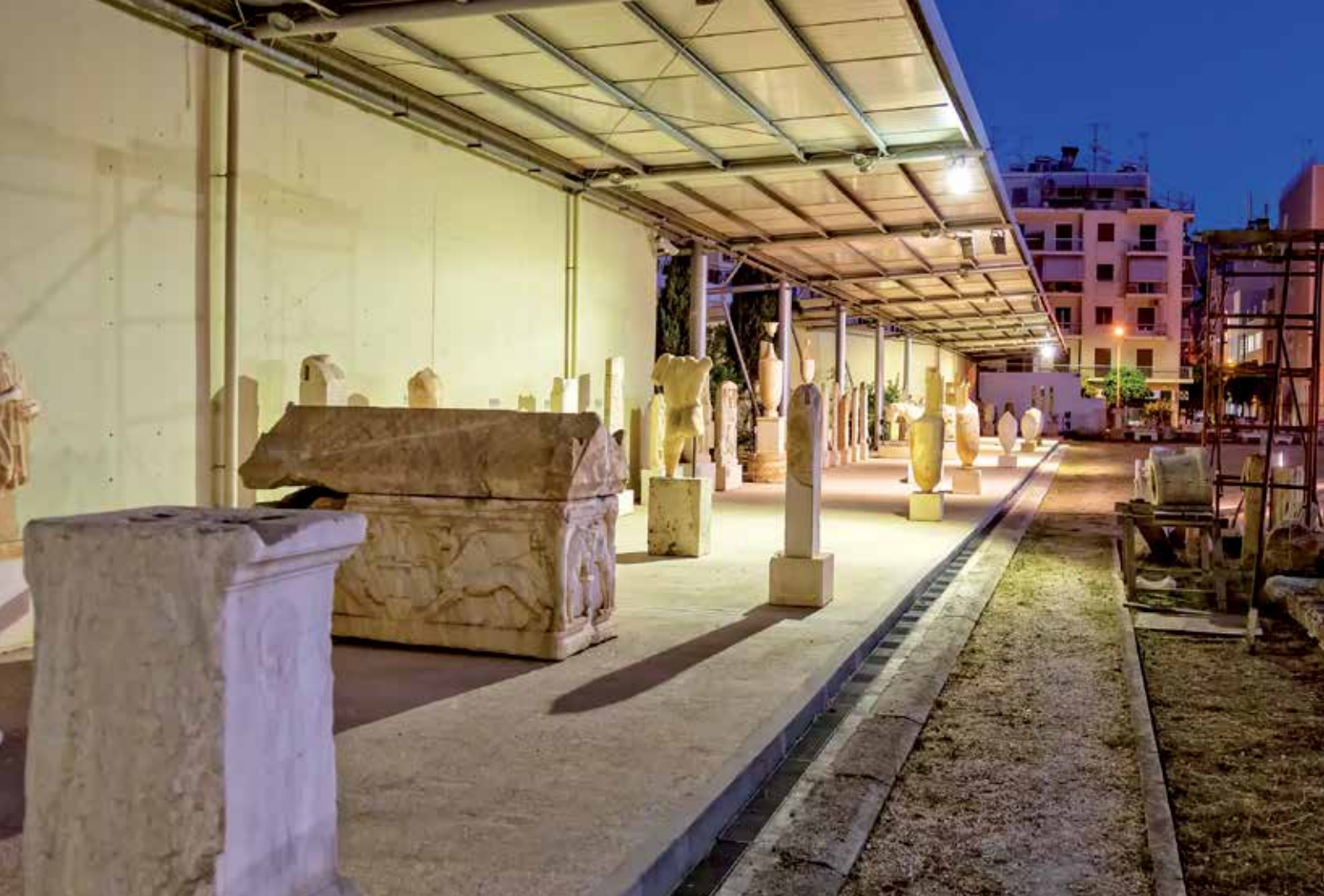
متحف الآثار في بيريه