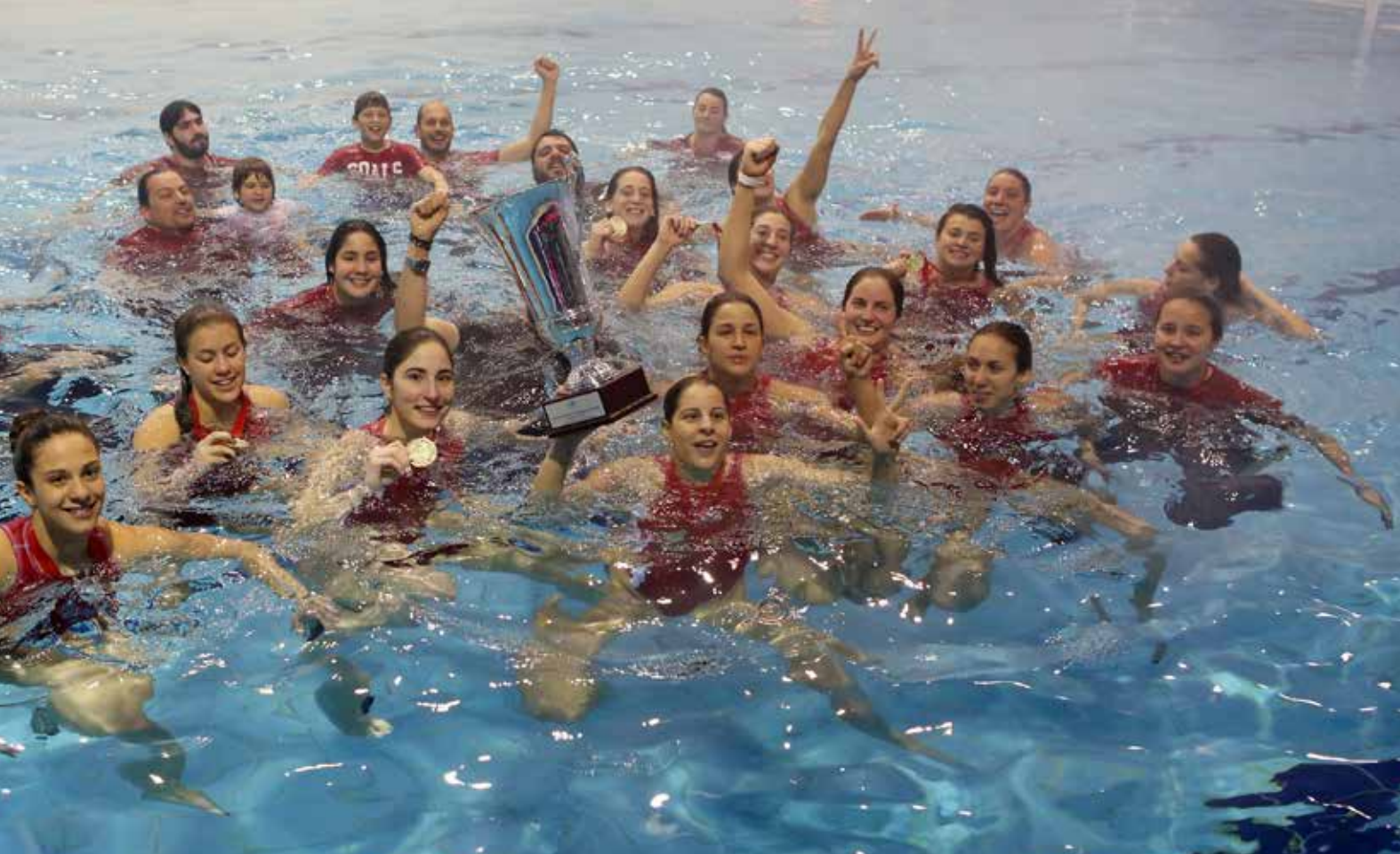
بولو السيدات/بطلات أوروبا 2014-2015

والعالمية والأوروبية الذين لا يعلى عليهم في تعزيز صورة النادي في جميع أنحاء العالم.