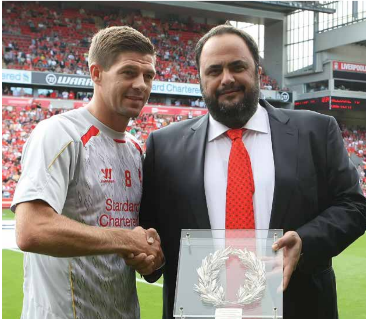
مباراة ودية مع ليفربول لتكريم ستيفن جيرارد (أغسطس 2013)