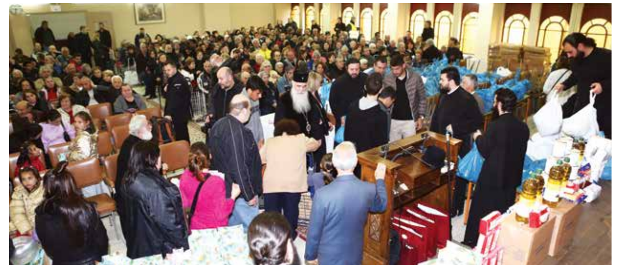
مشاركة في توزيع طعام للمحتاجين

كان ذلك إلتزام أخذه على عاتقه شخصياً السيد ماريناكيس عند مقابلة البطريرك المسكوني كيريوس كيريوس بارثلميو، أثناء زيارة أولمبياكوس للبطريركية المسكونية في إسطنبول. لا يعرف أولمبياكوس حدوداً في العمل الإجتماعي. إن النشاط الإجتماعي المتعدد لنادي أولمبياكوس يتخطى حدود اليونان، مثلما حدث في حالة "المباراة الودية ضد الفقر" التي اقيمت في سناد كرايسكاكيس عام 2010، بالتعاون مع القطاع المختص في منظمة الأمم المتحدة، مع أصدقاء زيدان ورونالدو، الذين لعبوا بغرض توفير المساعدة إلى المنكوبين في هايتي وباكستان. إستمر ذلك بتوفير الدعم المالي إلى المنكوبين من تسونامي اليابان عام 2011، حيث قام رئيس نادي أولمبياكوس بتسليم مبلغ بقره 100,000 يورو إلى سفير اليابان، السيد هيروشي توندا. بالإضافة إلى صيف عام 2013، في إطار المباراة الودية الكبيرة لتكريم ستيفن جيرارد، حيث أهدى الرئيس مبلغ 100,000 ليرة إسترليني إلى "مؤسسة ستيفن جيرارد"، لجعل إسم النادي الأسطورة معروفاً خارج خطوط الملعب.