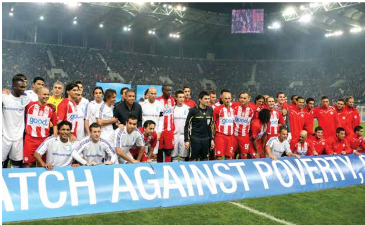
مباراة UNDP ضد الفقر (ديسمبر 2010)

جذور الإنسانية والعتاء إلى البشر عميقة في الجينات الخاص بأولمبيكوس، ومن الأجدد الآن أن يتم ذلك، حيث أصابت الأزمة الاقتصادية والاجتماعية بلدنا وأبرزت مشاكل متعددة تؤثر على الحياة اليومية لملايين البشر. إن تخفيف هذه المشاكل والدعم المادي والمعنوي من نادينا إلى من يعانون من الحاجة يعد أولوية لنا، مثلما أعلن مراراً رئيسنا، السيد ماريناكوس.