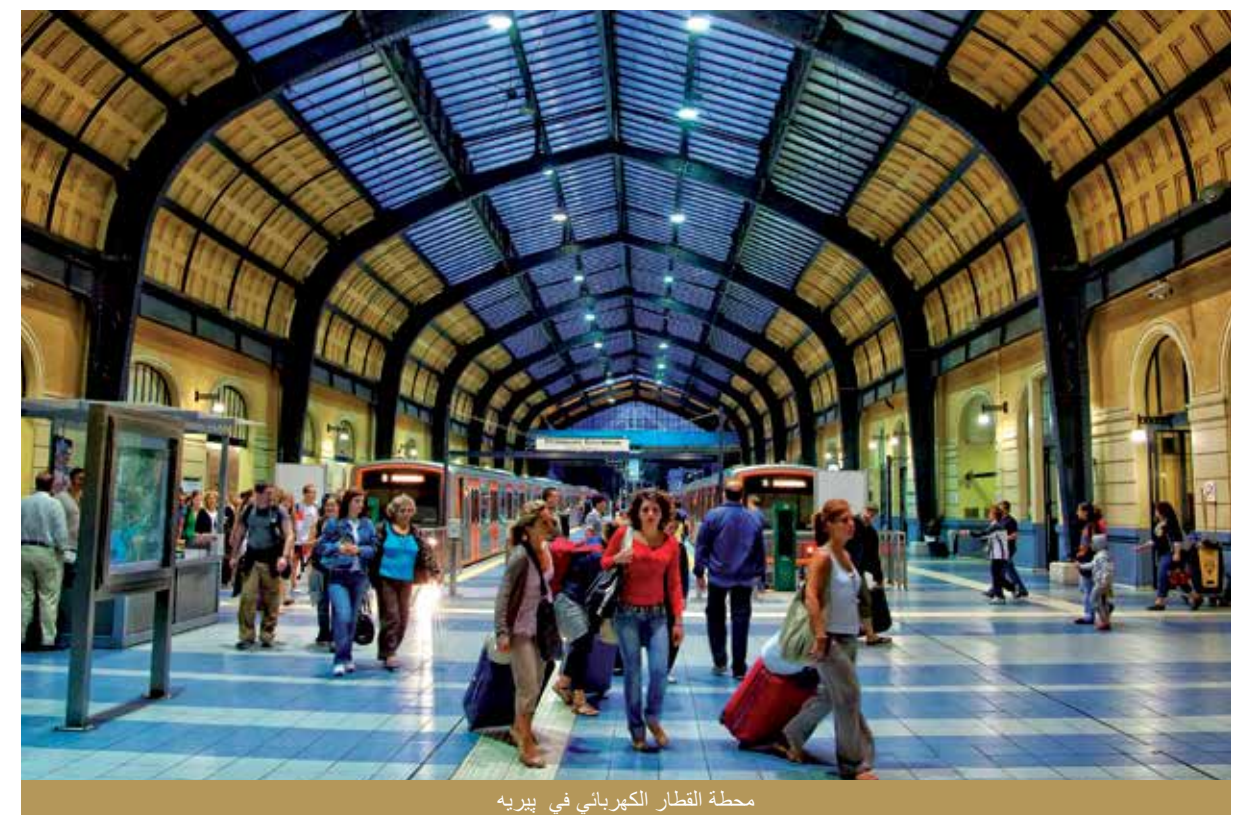
محطة القطار الكهربائي في بيريه