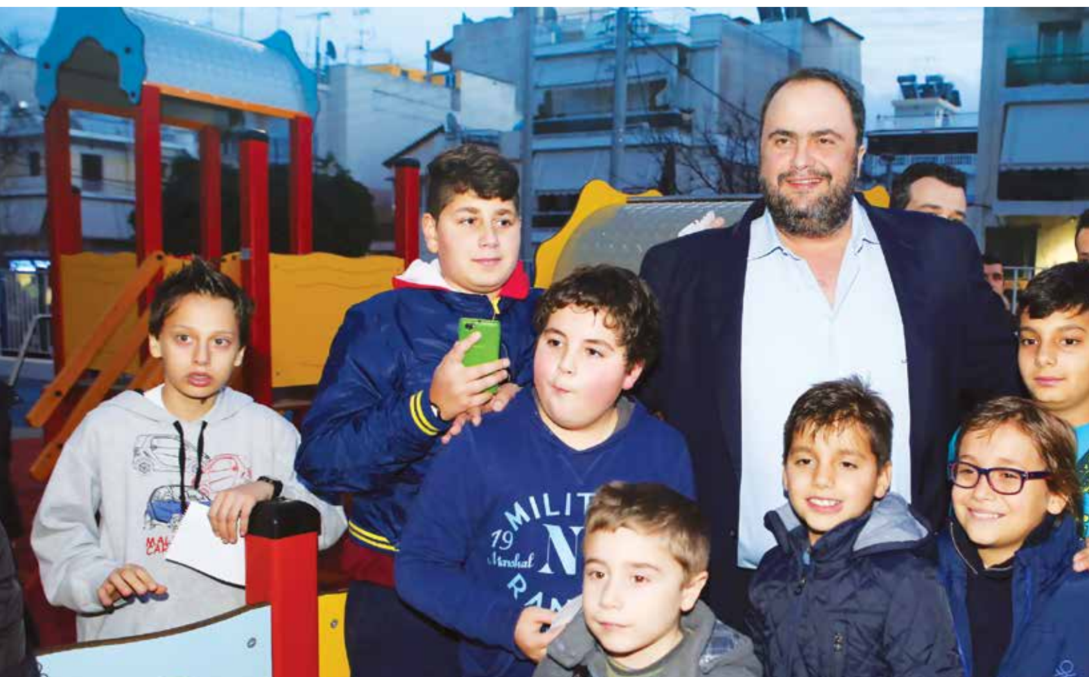
إفتتاح منطقة ترفيه للأطفال بالمدينة