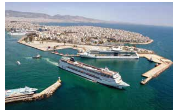
وجه آخر للميناء