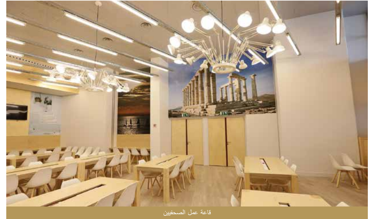
قاعة عمل الصحفيين

أعيد البناء في عام 1960 وتغير اسمه إلى إستاد "جورج كرايسكاكيس"، وهو الاسم الذي يحتفظ به حتى الآن. يرتبط هذا الاسم بتكريم القائد جورج كرايسكاكيس (1782 - 1827) الذي قُتل في منطقة نيو فاليريو، بالقرب من الإستاد الحالي، أثناء ثورة عام 1821.