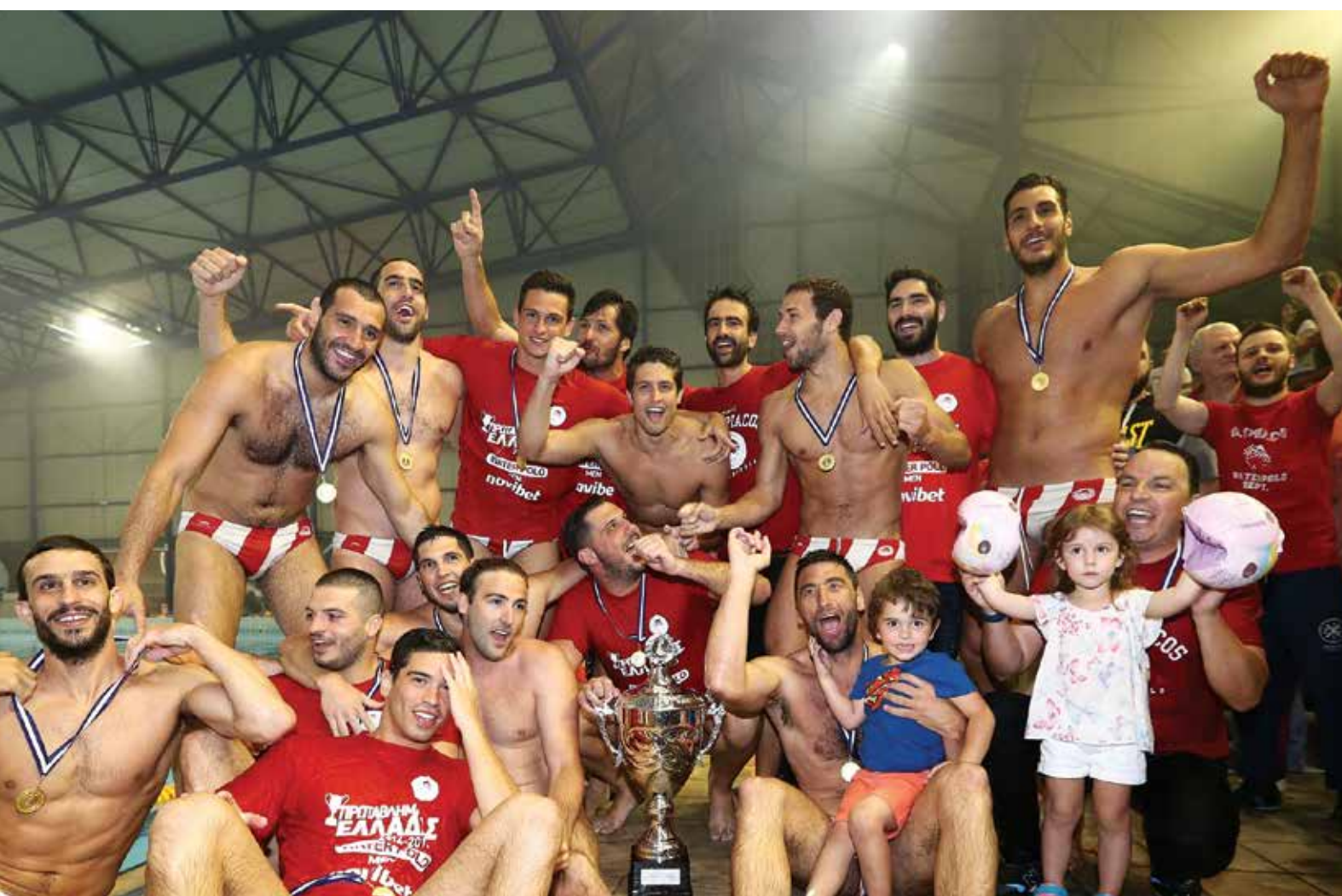
بولو الرجال/أبطال اليونان 2014-2015