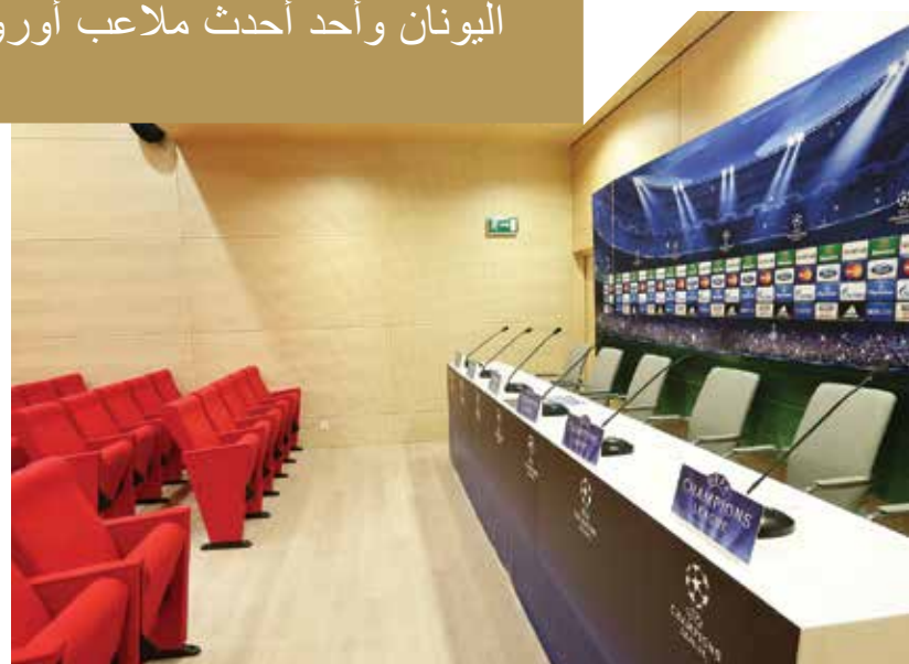
قاعة المؤتمرات الصحفية

رغم استخدام الإستاد من أندية أخرى (مثل إثنيكو وپرووديثيكي) إلا أنه يرتبط بنادي أولمبياكوس، الذي عاش فيه أوقات من المجد والانتصار! لكن في عام 2003، تم هدم الإستاد التاريخي وأنشئ مكانه ملعباً آخر حديثاً جداً لكرة القدم بصورة بحثة، تبلغ سعته 32,115 متفرج، مسقوف كلياً. أصبح ملعب أولمبياكوس أكثر سخونة وقوة، ويتوفر للفريق أحدث ملعب في اليونان وأحد أحدث الملاعب في أوروبا! لقد عاش أصدقاء أولمبياكوس أمسيات عظيمة في العشر سنوات منذ إنشاء ملعب "كرايسكاكيس" الجديد ومن المتوقع أن يعيشوا المزيد منها!