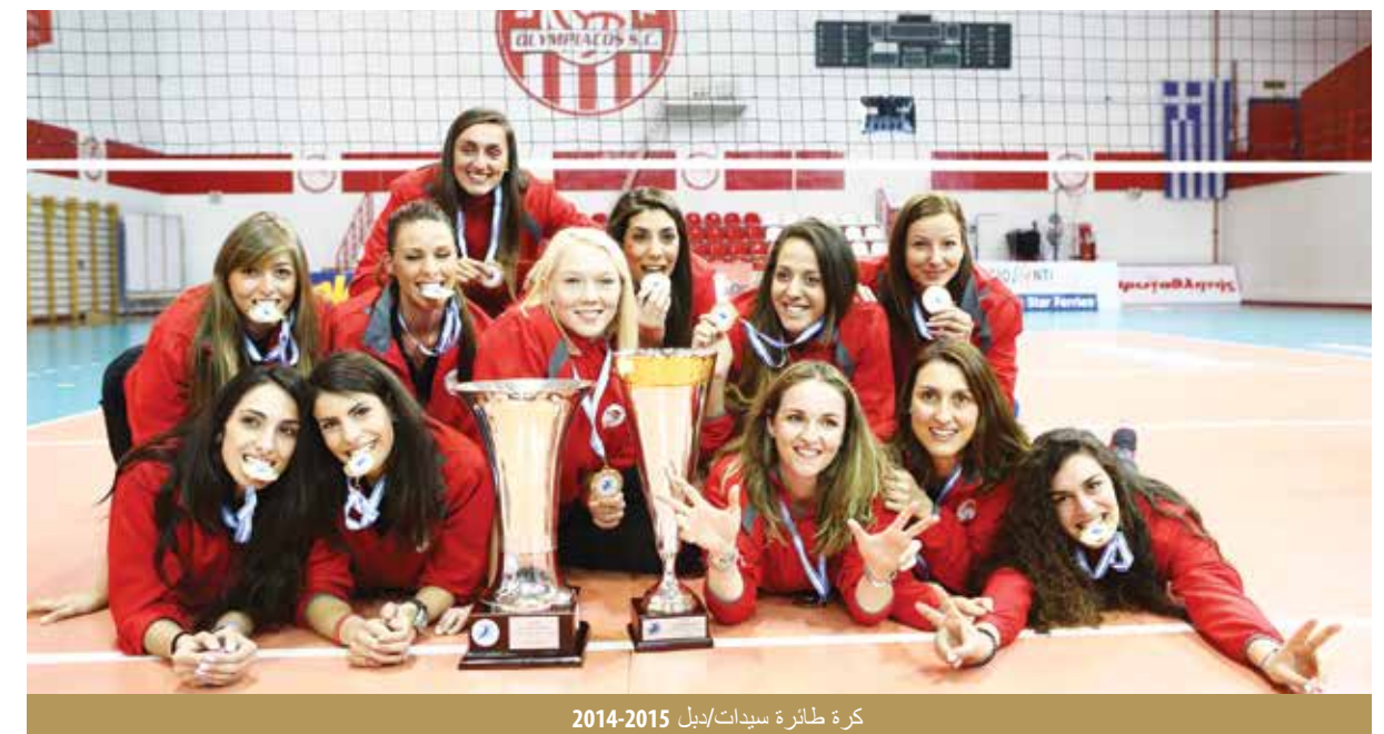
كرة طائرة سيدات/دبل 2014-2015