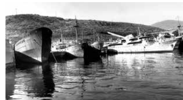
ميناء بيريه القديم

في عام 1834، بعد التحرير، انتقلت عاصمة الدولة اليونانية الحديثة من نافبليو إلى أثينا، فبدأ عصر جديد لميناء بيريه، حيث كانت العاصمة الجديدة تحتاج إلى ميناء كبير جدير بالعاصمة. لذلك، خلال السنوات التالية شهد بيريه تطوراً ديمغرافياً، وتجارياً وصناعياً هائلاً. في أوائل القرن الـ20، جذبت الناس من جزر سارونيك، وسيكلاديز، وخيوس،