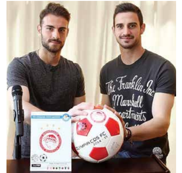
ندعم جمعية "خامويلو تو بيديو"

يقدر العطاء الإجتماعي إلى بلدية بيريه بعشرات من الأنشطة الهامة التي غيرت الحياة اليومية للمواطنين للأفضل، سواء من الصغار أو الكبار. يقوم أولمبيكوس كذلك بتوفير الدعم اليومي لإطعام المحتاجين بواسطة كنيسة بيريه وكنائس أخرى ومطاعم مخيمات المطرانية بالإسهام في أنشطة الكنيسة، حيث