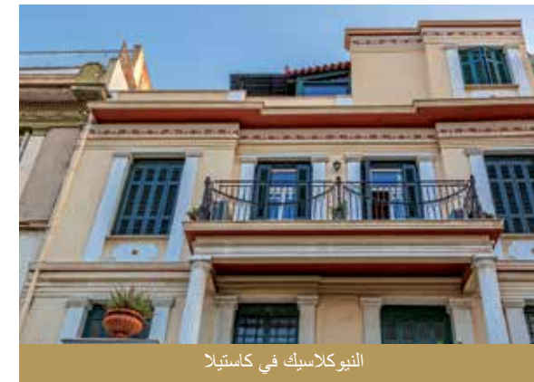
النيو كلاسيك في كاستيلا