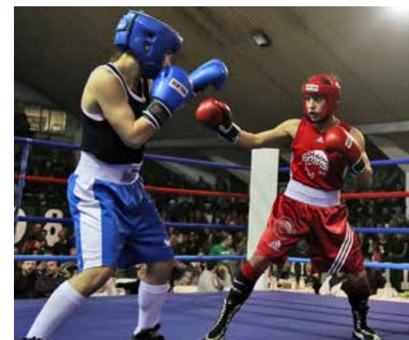
ملاكمة سيدات/بطل اليونان 2014-2015