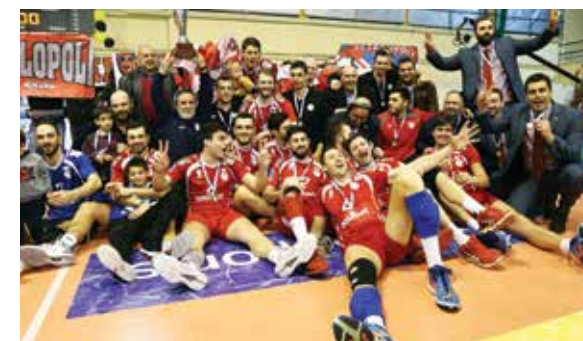
كرة طائرة رجال/كأس ليغ 2014-2015

إن النادي الذي "أنجب" فريقي كرة القدم وكرة السلة التي ترتبط بأولمبياكوس، الذي كتب مسيرته على الصعيدين المحلي والأوروبي، يرتبط بالمنافسة على البطولات! أولمبياكوس "ينجب" أبطال ويعد قاعدة الفرق الوطنية في جميع الرياضات. يشمل أولمبياكوس في صفوفه أبطال في الألعاب الأولمبية