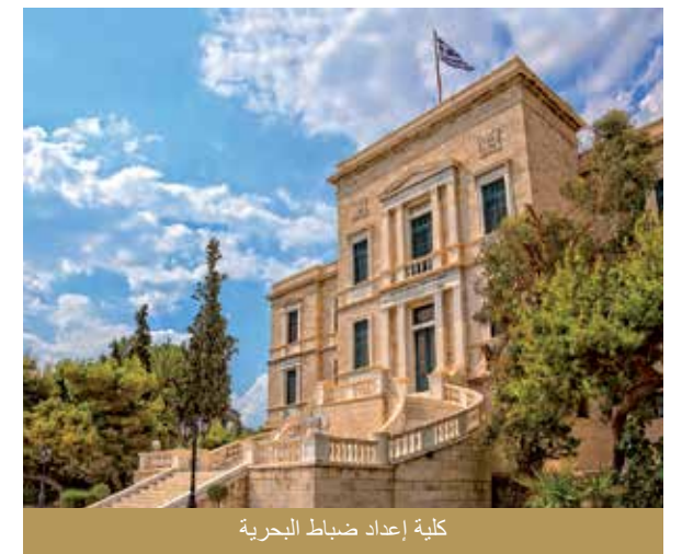
كلية إعداد ضباط البحرية