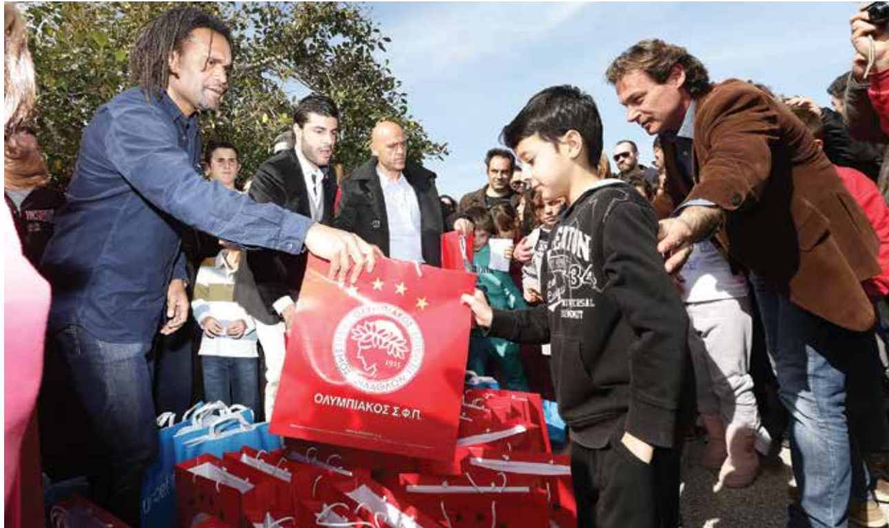
زيارة إلى ضحايا الزلزال في كيفالونيا