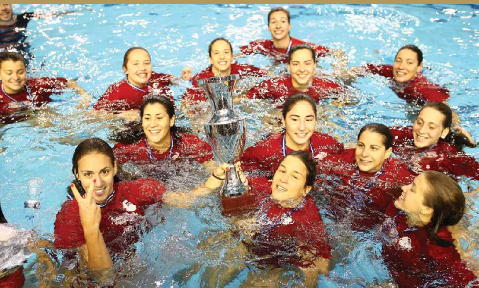
پولو السيدات/بطل اليونان 2014-2015