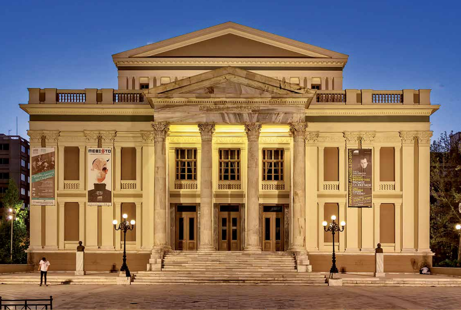
مسرح بلدية بيريه