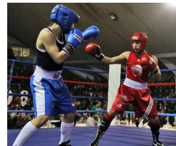
BOXE FEMMINILE/CAMPIONESSA DI GRECIA 2014-2015