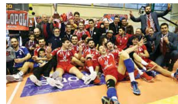
PALLAVOLO MASCHILE/LEAGUE CUP 2014-2015

Il nostro club è stato il primo in Grecia ad elaborare un programma di iscrizione di massa dei soci, allo scopo di far partecipare i tifosi all'evoluzione sportiva. L'OLYMPIACOS è in questo momento il più grande club di massa in Grecia, visto che 11 anni dopo l'elaborazione del programma soci si sono iscritti – dall'ultima liquidazione del registro – più di 98.000 soci. Alla