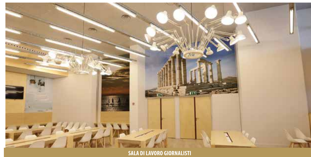
SALA DI LAVORO GIORNALISTI

Gli spogliatoi della nostra squadra, al Karaiskakis, sono stati ristrutturati nell'estate del 2014 ed hanno acquisito una nuova ... meravigliosa immagine! Ultramoderni, confortevoli come non dalla quale escono preparati nel «campo di battaglia», il campo di gioco! Contemporaneamente sono stati ristrutturati gli spazi interni dello stadio, con la sala Stampa, la sala di lavoro per i giornalisti e la reception