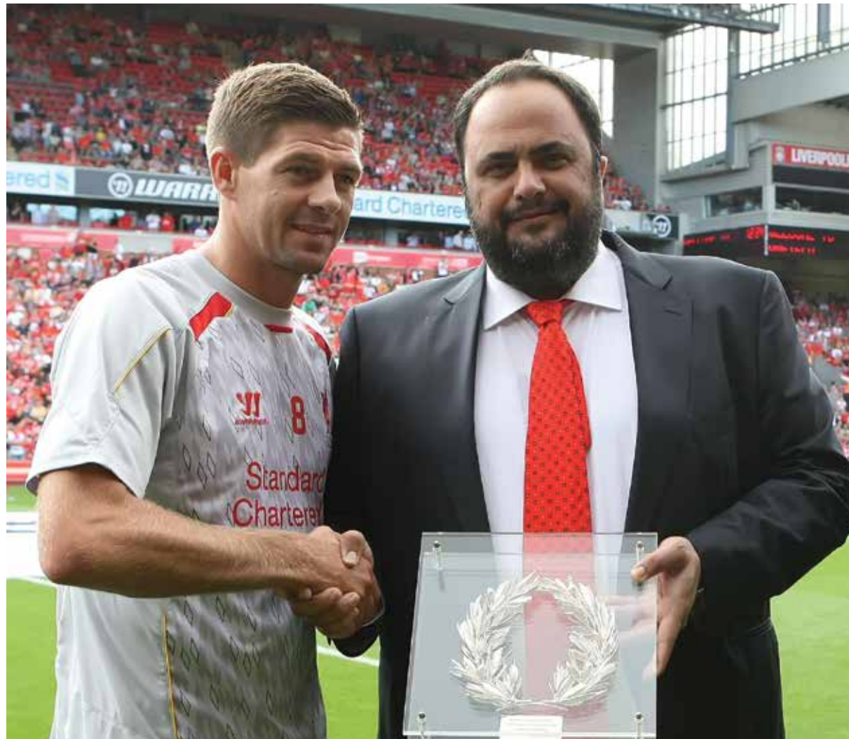
AMICHEVOLE CON IL LIVERPOOL IN ONORE DI STEVEN GERRARD (AGOSTO 2013)