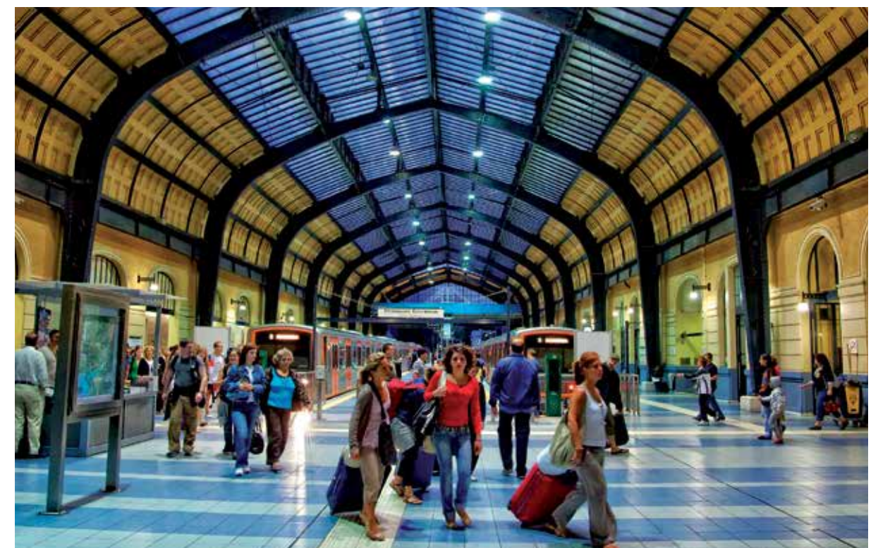
LA STAZIONE DELLA FERROVIA ELETTRICA A PIREO