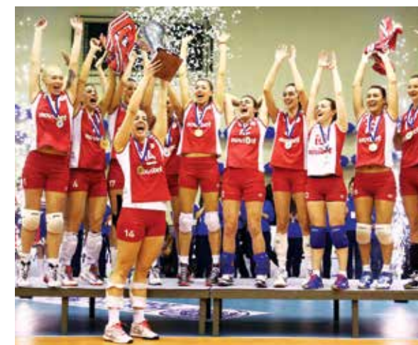
PALLAVOLO FEMMINILE/COPPA DI GRECIA 2014-2015

Obiettivo dell'OLYMPIACOS per la stagione agonistica 2015-16 è l'affermazione in ambito europeo in tutti gli sport. Il club è l'unico in Grecia ad aver vinto titoli in Europa in più di uno sport. Nella pallavolo l'OLYMPIACOS ha vinto la Coppa delle Coppe il 1996 e la Top Teams Cup nel 2005, nella Pallanuoto ha vinto la Champions League e Supercoppa Europea maschile il 2002, per le donne la Coppa Europea dei Campioni il 2015 e il Len Trophy nel 2014. Nella lotta l'OLYMPIACOS ha conquistato il titolo europeo e naturalmente può vantare tre Campionati Europei della pallacanestro, nel 1997, 2012 e 2013.