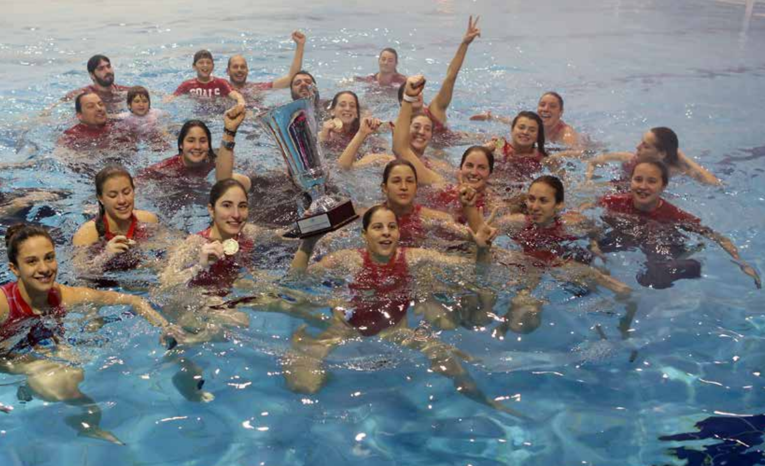
PALLANUOTO FEMMINILE/CAMPIONI D'EUROPA 2014-2015