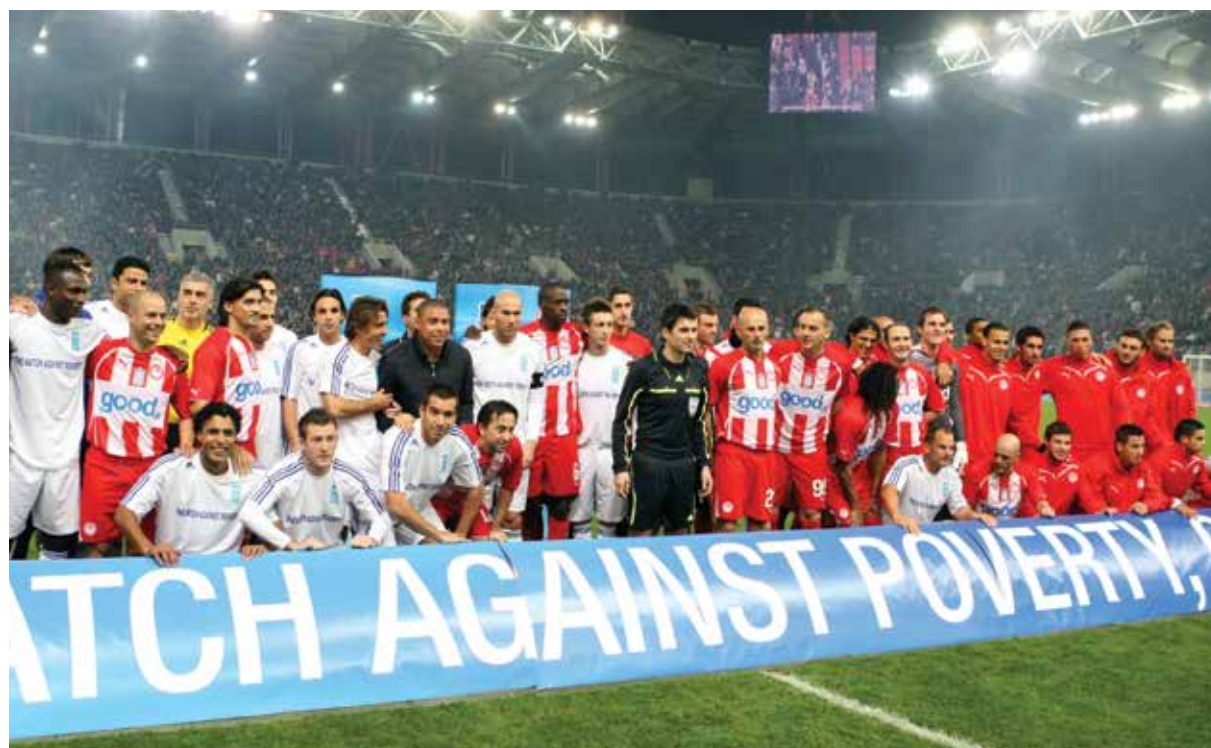
UNDP - PARTITA CONTRO LA POVERTA' (DICEMBRE 2010)

Nell'Olympiacos i significati di beneficenza e offerta al prossimo sono profondamente radicati nel nostro DNA. Tanto più adesso, quando la crisi economica e sociale che ha colpito il nostro Paese ci evidenzia molteplici problemi che influenzano la quotidianità di milioni di persone. L'alleggerimento di questi problemi e il supporto continuo materiale e morale del club, verso istituzioni e persone che hanno bisogno, costituisce una nostra priorità come più volte ha ripetuto il nostro Presidente Sig. Marinakis.