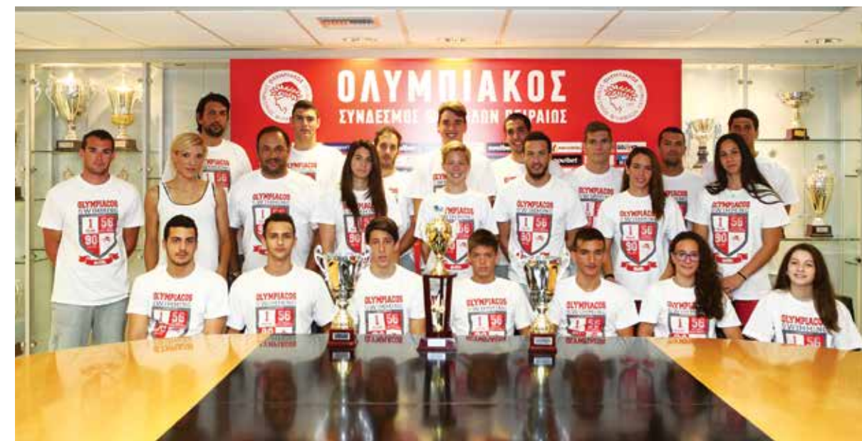
NUOTO/CAMPIONATO UOMINI DONNE COMPLESSIVO 2015-2016