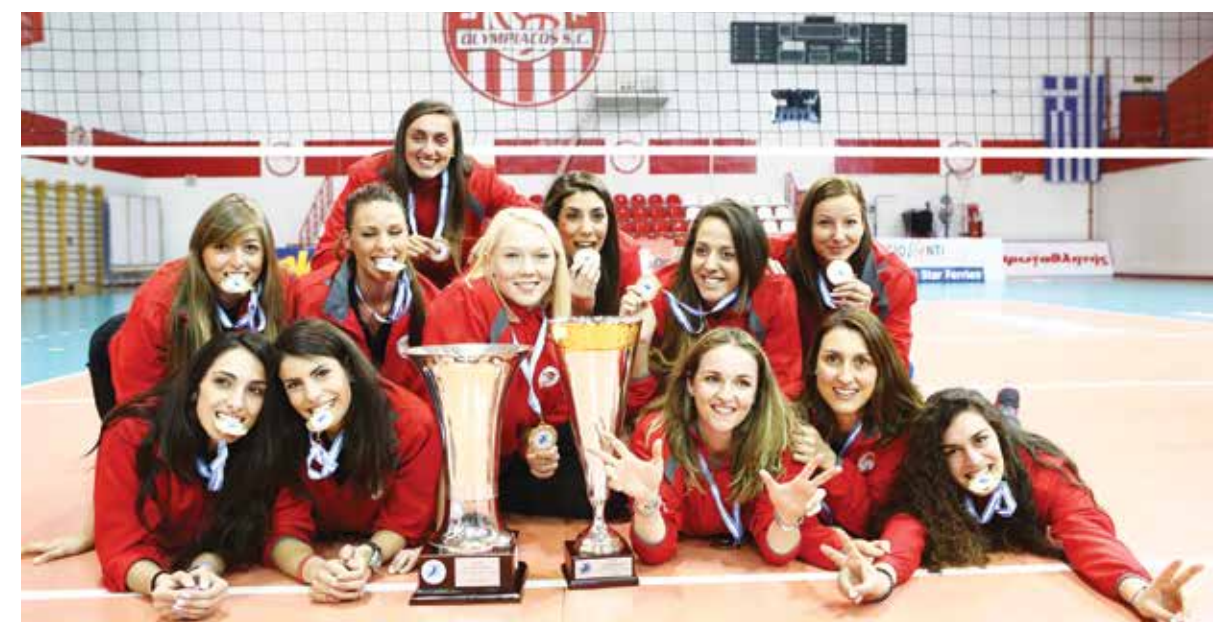
PALLAVOLO FEMMINILE/DOUBLE 2014-2015