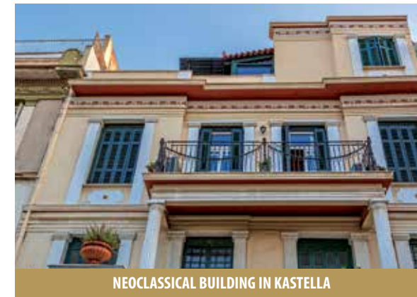
NEOCLASSICAL BUILDING IN KASTELLA

La catastrofe dell'Asia Minore nel 1922 e lo sradicamento dell'Ellenismo proprio dall'Asia Minore, ebbe come risultato il riversamento al Pireo di numerosissimi profughi e la popolazione raddoppiò. Ma ciò che ha più importanza è che l'elemento profughi contribuì in modo significativo a conformare la fisionomia ed il carattere culturale della città. Ultima avventura del Pireo fu la Seconda Guerra Mondiale, durante la quale subì continui bombardamenti. La fine della guerra segnò l'inizio della ricomposizione della città, la quale, in combinazione con le prestazioni della marina mercantile ellenica e la sua nomina a potenza mondiale del post conflitto, trasformò il Pireo nel più grande porto del Mediterraneo Orientale.