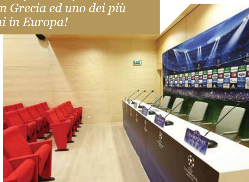
SALA CONFERENZE STAMPA

Il «Georgios Karaiskakis» fu costruito nel 1895, come Velodromo. L'obiettivo era quello di essere usato per i Giochi Olimpici di Atene del 1896. La prima volta fu usato come campo di calcio nel decennio del 1920.