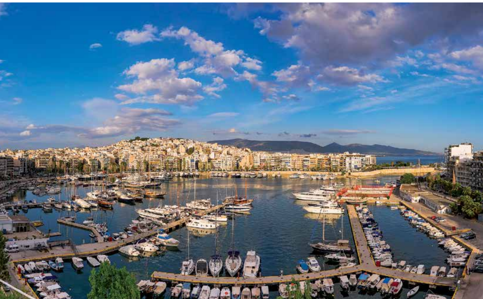
IL MERAVIGLIOSO PASALIMANI

la riqualifica delle strutture. Furono costruiti serbatoi stabili sulla Costa Ietonia e fu costruito il meraviglioso Teatro Comunale del Pireo.