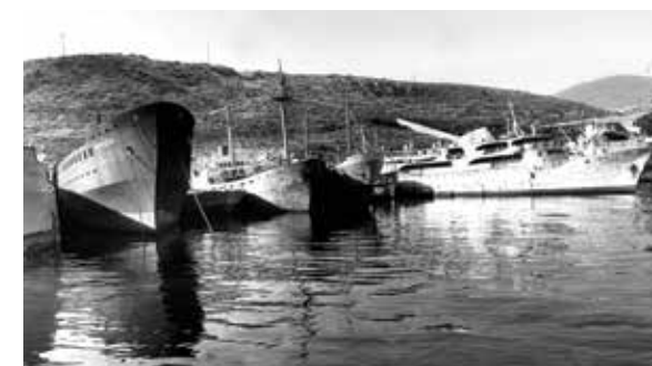
IL VECCHIO PORTO DI PIREO

Nel 1834, dopo la Liberazione, la capitale dello stato ellenico appena costituito, fu trasferita da Nafplio ad Atene ed una nuova epoca fiorì per il Pireo, in quanto la nuova capitale doveva avere un porto degno. Così negli anni a seguire il Pireo conobbe un febbrile sviluppo demografico, urbano, commerciale e industriale. All'inizio del XX° secolo, attirò gente dalle isole del Saronico, Cicladi, Chios, Creta e dalla regione Mani. Dopo lo sviluppo seguì