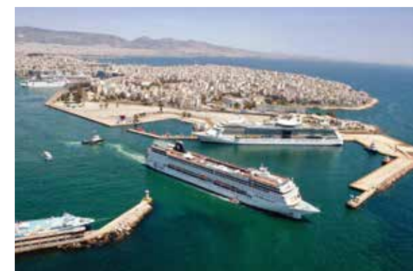
UN'ALTRA VEDUTA DEL PORTO