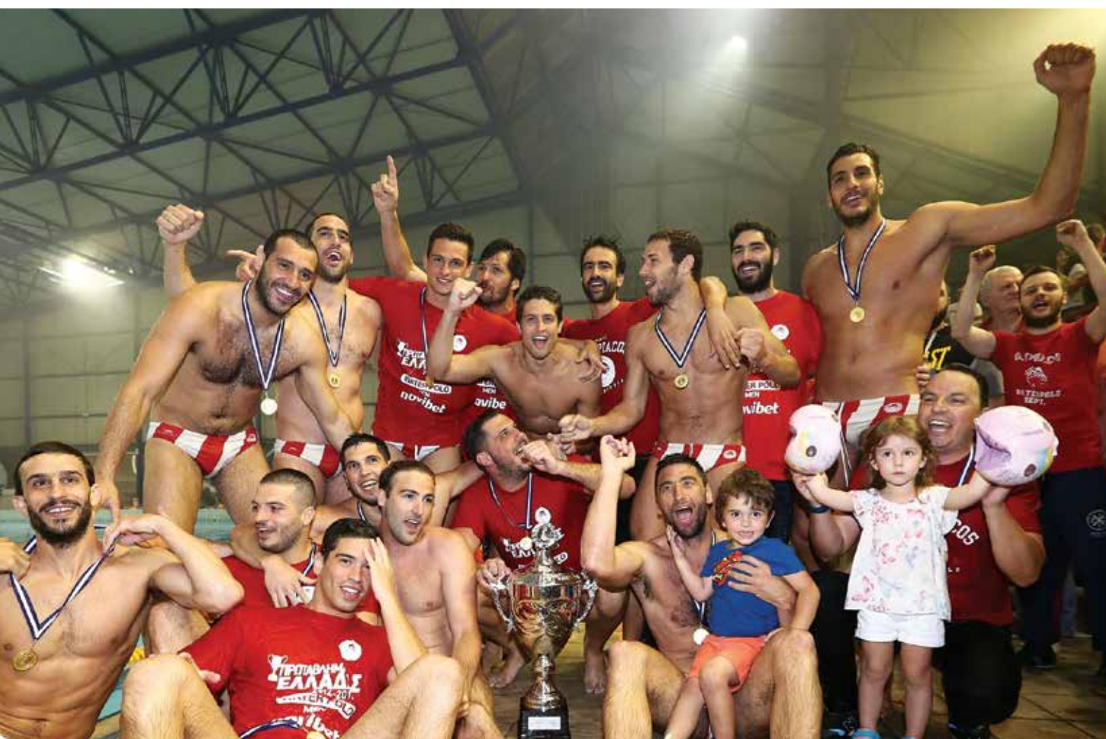
PALLANUOTO MASCHILE/CAMPIONI DI GRECIA 2014-2015