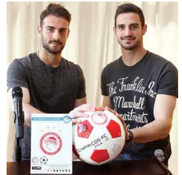
SUPPORTIAMO <IL SORRISO DEL BAMBINO>

Rispettivamente, l'offerta sociale al Comune di Pireo, si conta in numerose attività importanti che hanno cambiato in meglio la quotidianità dei cittadini, piccoli e grandi. L'Olympiacos sup-