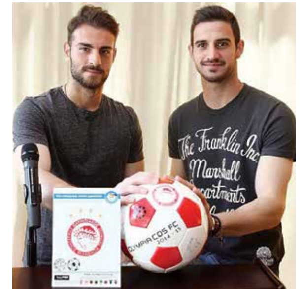
APOIAMOS O "SORRISO DA CRIANÇA"

Da mesma forma, a dádiva social ao Município do Pireu conta com dezenas de importantes acções, que mudaram para melhor o quotidiano dos cidadãos, tanto os mais jovens como os mais velhos. O Olympiacos apoia diariamente e cobre todas as despesas