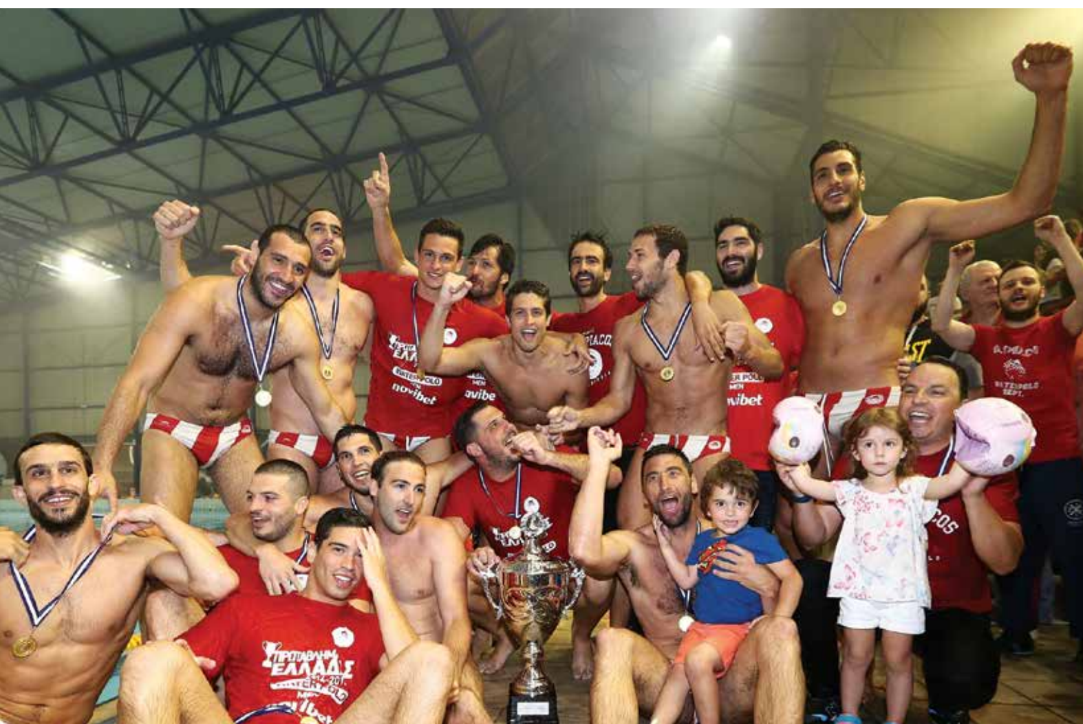
PÓLO AQUÁTICO MASCULINO / CAMPEÕES DA GRÉCIA 2014-2015