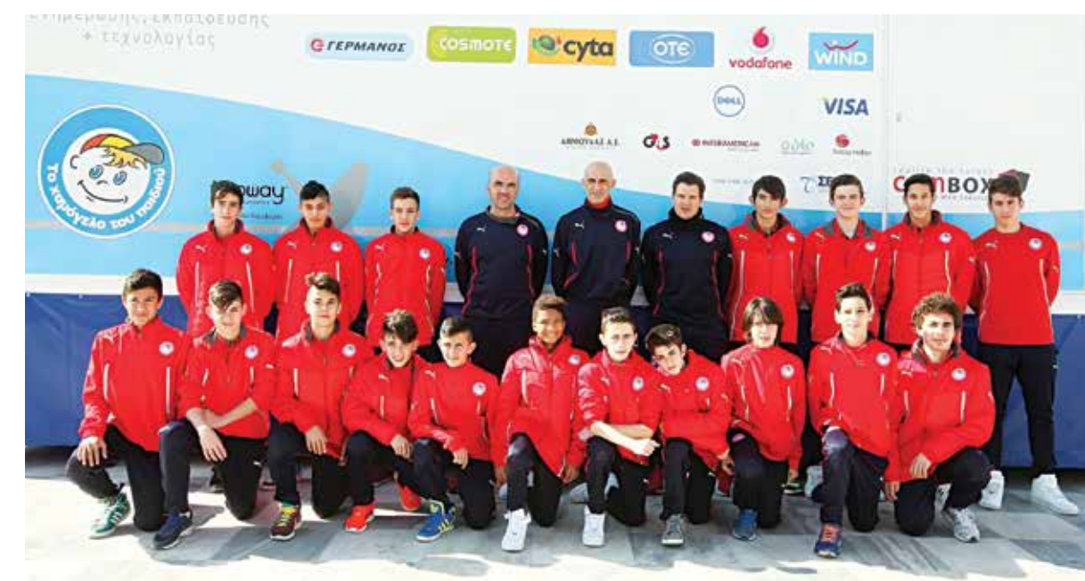
ACTIVIDADES DA ACADEMIA

UEFA Youth League-Campeonato Superleague Sub-20 Campeonato Superleague Sub-17 Participação em torneios Campeonato Superleague Sub-15 Campeonato ACF do Pireu, torneios Campeonato ACF do Pireu, torneios Participação em torneios Participação em torneios Participação em torneios Participação em torneios Participação em torneios