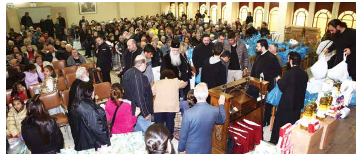
PARTICIPAÇÃO NA DISTRIBUIÇÃO DE REFEIÇÕES DE CARIDADE