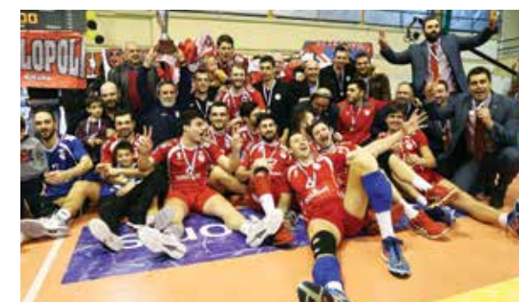
VÓLEI MASCULINO / TAÇA DA LIGA 2014-2015