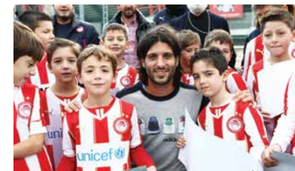
ESCOLAS / BÊNÇÃO