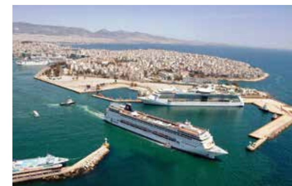
UMA OUTRA PERSPECTIVA DO PORTO