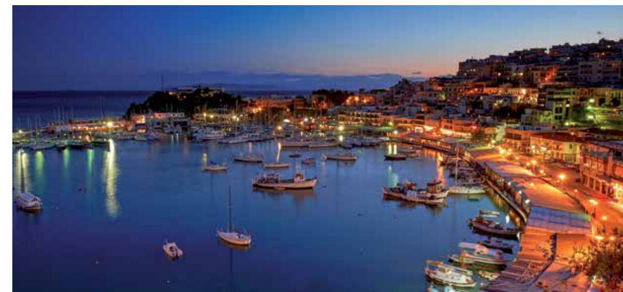
O ENCANTADOR MICROLIMANO