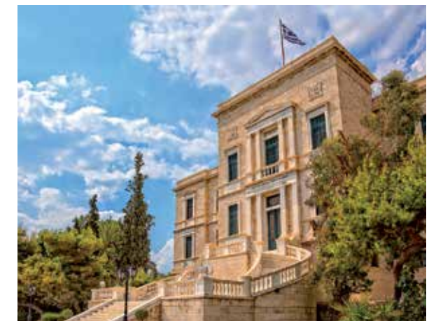
A ESCOLA DE CADETES DA MARINHA