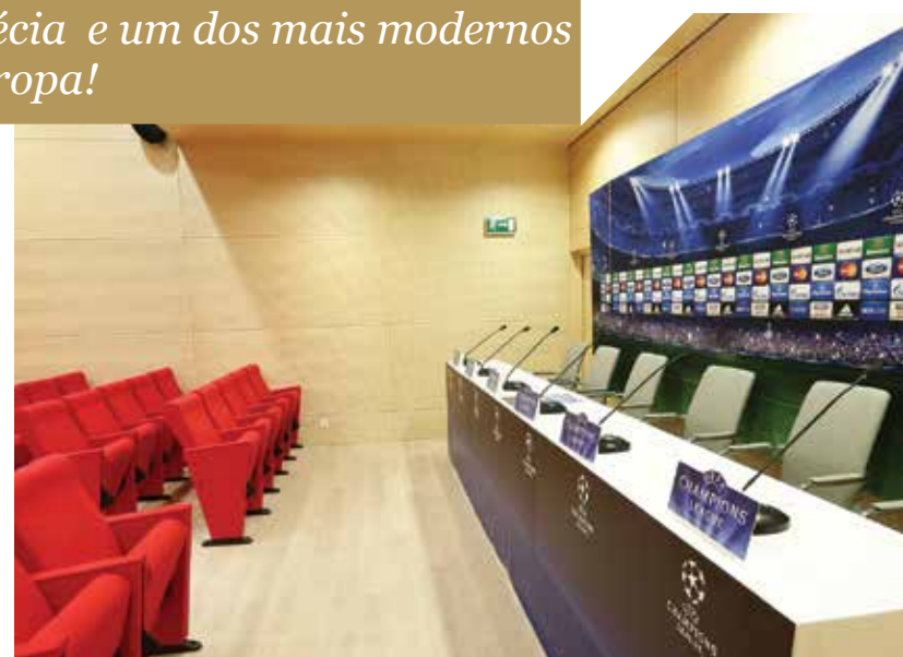
SALA DE CONFERÊNCIAS DE IMPRENSA