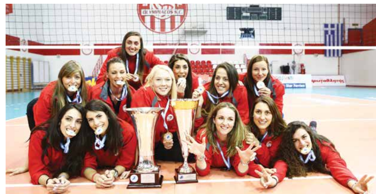
VÓLEI FEMININO / DOBRADINHA 2014-2015