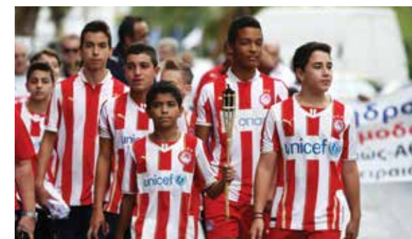
ESCOLAS / ACÇÃO SOCIAL