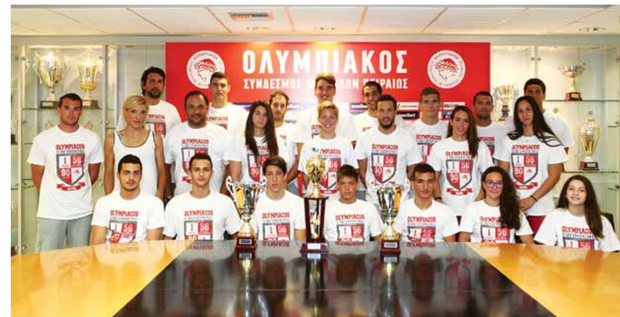
NATAÇÃO / CAMPEONATO MASCULINO E FEMININO COMBINADO 2015-2016