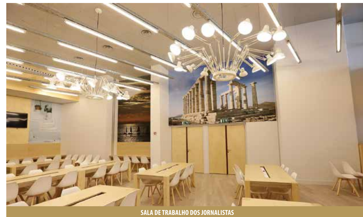
SALA DE TRABALHO DOS JORNALISTAS