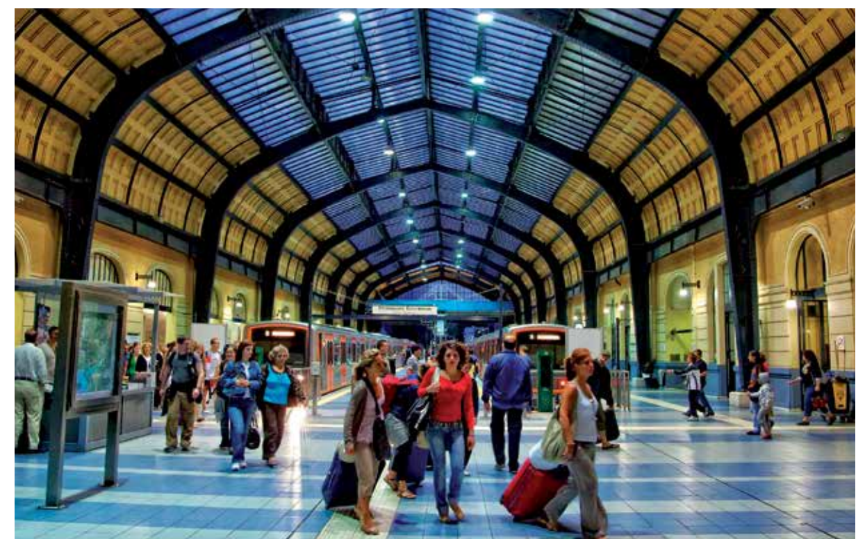
A ESTAÇÃO DE METRO NO PIREU