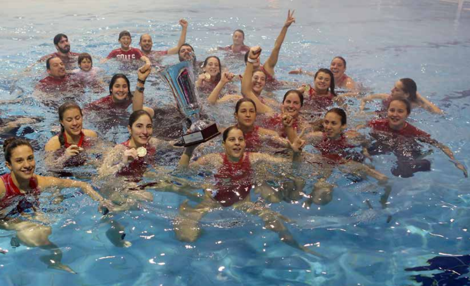
PÓLO AQUÁTICO FEMININO / CAMPEÃS EUROPEIAS 2014-2015

O OLYMPIACOS é neste momento a instituição na Grécia com mais