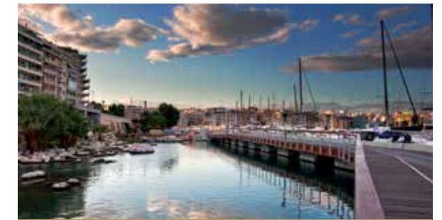
A HISTÓRICA MARINA ZEAS

A Catástrofe da Ásia Menor de 1922 e o desenraizamento da população helénica da Ásia Menor fizeram o Pireu receber um importante número de refugiados e a população duplicou. No entanto, o que tem maior importância é que a identidade dos refugiados contribuiu substancialmente para a formação do aspecto, bem como do carácter cultural da cidade. A última peripécia do Pireu foi a Segunda Guerra Mundial, durante a qual foi alvo de repetidos bombardeamentos. O fim da guerra assinalou o início da reconstrução da cidade, que, em combinação com o rendimento da marinha mercante grega, que se revelou uma potência mundial do pós-guerra, transformou o Pireu no maior porto do Mediterrâneo Oriental.