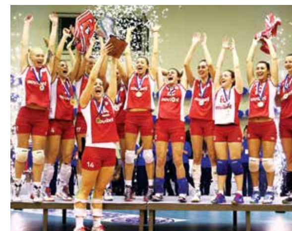
VÓLEI FEMININO / TAÇA DA GRÉCIA 2014-2015

O Objectivo do OLYMPIACOS na época desportiva de 2015-16 é o reconhecimento na Europa em todos os desportos. O clube é o único na Grécia a ter conquistado títulos na Europa em mais de uma modalidade. No Vólei o OLYMPIACOS ganhou a Taça das Taças em 1996 e o Top Teams Cup em 2005, enquanto no Pólo Aquático Masculino conquistou a Champions League e a Supertaça Europeia em 2002 e no Feminino a Taça dos Campeões Europeus em 2015 e o Len Trophy em 2014. O OLYMPIACOS ganhou um título europeu também na Luta. O clube tem, claro, para mostrar três títulos de campeão europeu no basquetebol, em 1997, 2012 e 2013.