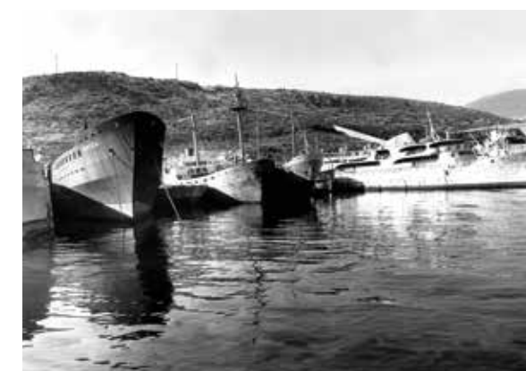
O ANTIGO PORTO DO PIREU

Em 1834, após a libertação do domínio otomano, a capital do recém-formado estado grego foi transferida de Nafplio para Atenas e começou aí uma nova época de crescimento para o Pireu, pois a nova capital teria de ter um porto à sua altura. Assim, nos anos que se seguiram, o Pireu conheceu um frenético desenvolvimento demográfico, urbanístico, comercial e industrial. No início do século XX, atraiu gente das ilhas do Golfo Sarónico, das ilhas Cíclades, da ilha de Quios, de Creta e de Mani. Ao desenvolvimento seguiu-se a melhoria das infra-estruturas. Foram construídos tanques permanentes na Costa Eetioneia e lançaram-se os alicerces do magnífico Teatro Municipal do Pireu.