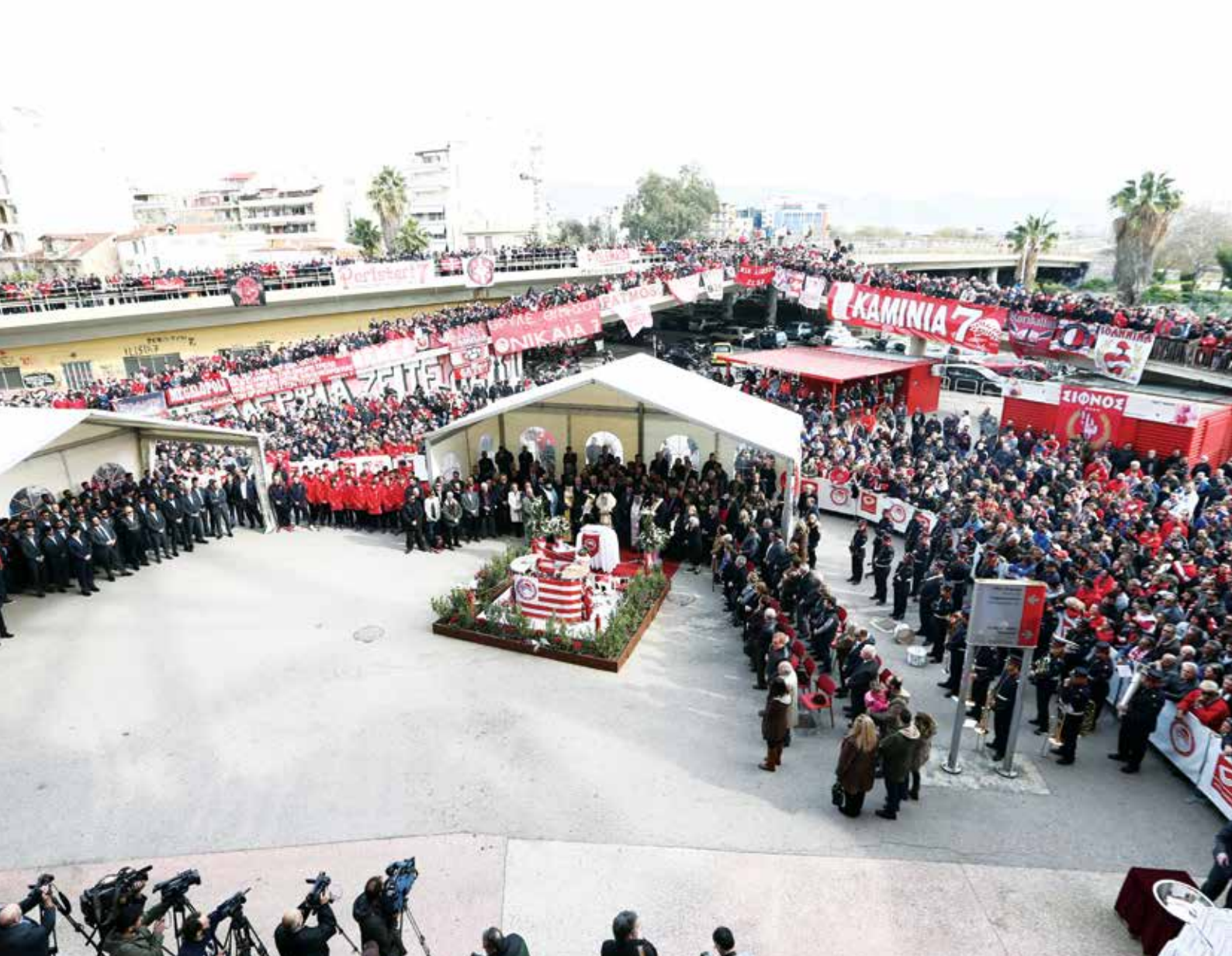
MONUMENTO EM MEMÓRIA DAS VÍTIMAS DA TRAGÉDIA DA PORTA 7 (2015)