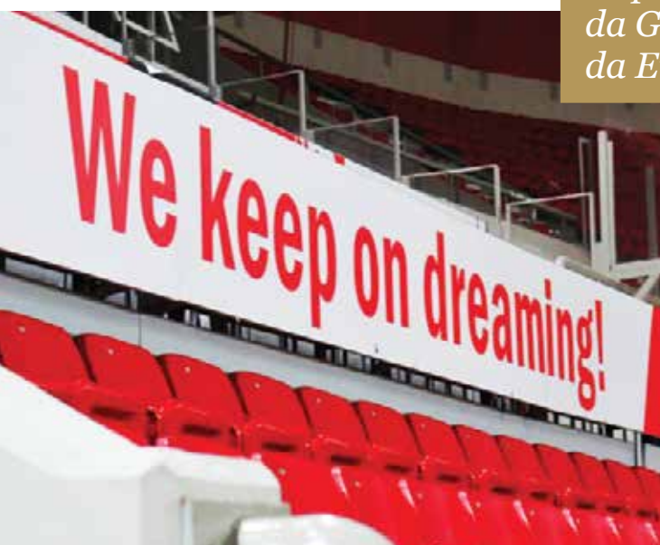
CABINAS DA IMPRENSA

A casa do Olympiacos tornou-se ainda mais “quente” e “forte” e a equipa dispõe do mais moderno estádio da Grécia e um dos mais modernos da Europa!