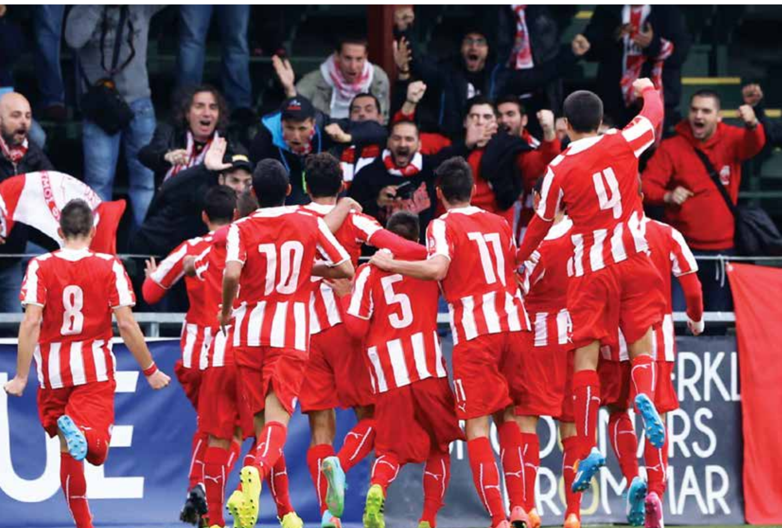
UEFA YOUTH LEAGUE