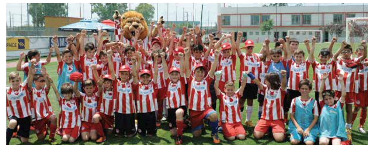
ESCOLAS / CAMPOS