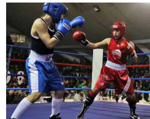
PUGILISMO FEMININO / CAMPEÃS DA GRÉCIA 2014-2015