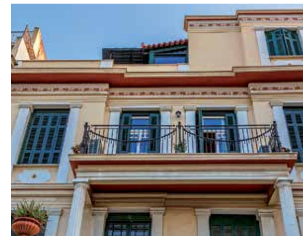
EDIFÍCIO NEOCLÁSSICO EM KASTELLA