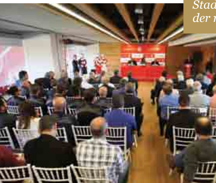
DIE V'AMMOS EVENT HALLE

Die neue Heimat von Olympiakos wurde noch "heißer" und noch stärker und die Mannschaft erhielt das modernste Stadion Griechenlands und eines der modernsten in Europa!