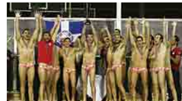
DIE HERRENMANNSCHAFT WASSERPOLO / GRIECHISCHE CUP GEWINNER 2013-2014