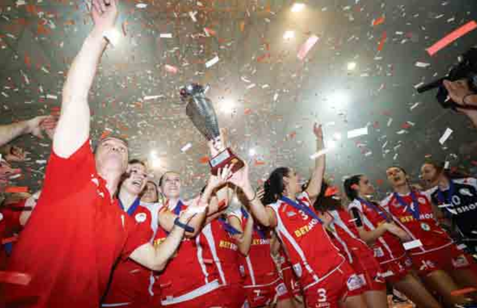
DIE VOLLEYBALL MANNSCHAFT DER FRAUEN / GRIECHISCHE MEISTERSCHAFT 2013-2014

Unser Club ist der erste Sportclub in Griechenland der ein Programm für zahlreiche Anmeldungen von Mitgliedern erstellt hat, mit dem Ziel die Fans in die Entwicklungen des Sports einzubinden.