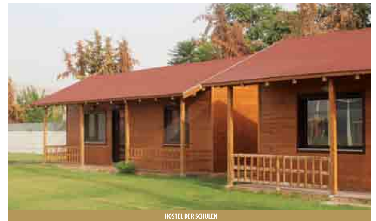
HOSTEL DER SCHULEN