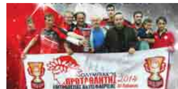
DIE HERRENMANNSCHAFT TISCH TENNIS / GRIECHISCHE MEISTERSCHAFT 2013-2014