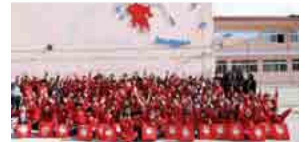
BESUCH IN TICHERO EVROS

In den vergangen Aktionen von Olympiakos ragt besonders das Freundschaftsspiel „Match against Poverty“ heraus. Die freundschaftliche Begegnung fand am 04. Dezember 2010 in Kooperation mit