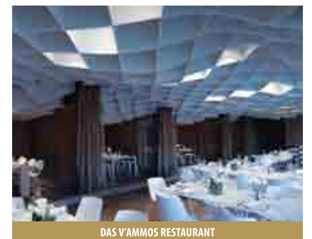
DAS V'AMMOS RESTAURANT