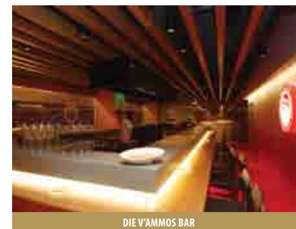
DIE V'AMMOS BAR