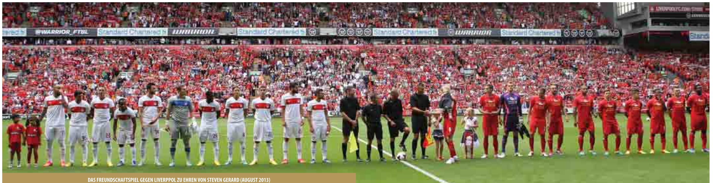
DAS FREUNDSCHAFTSPIEL GEGEN LIVERPOOL ZU EHREN VON STEVEN GERARD (AUGUST 2013)