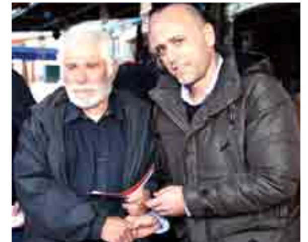
UNTERSTÜTZUNG DER BETROFFENEN BEVÖLKERUNG AUF DEN PSERIMOS UND KALIMNOS INSELN

Natürlich wird besonders das Testspiel gegen Liverpool im Sommer 2013 hervorgehoben. Die Legende wohnte der Ehrenfeier für Steven Gerrard, Liverpool's Kultkapitän, bei und leistete gleichzeitig einen Beitrag für soziale Projekte. Unser Präsident Herr Marinakis spendete die Summe von 100.000 GBP an die Steven Gerrard Stiftung, dass unserer Legende Anerkennung über die Welt des Fußballs hinaus verschaffte!