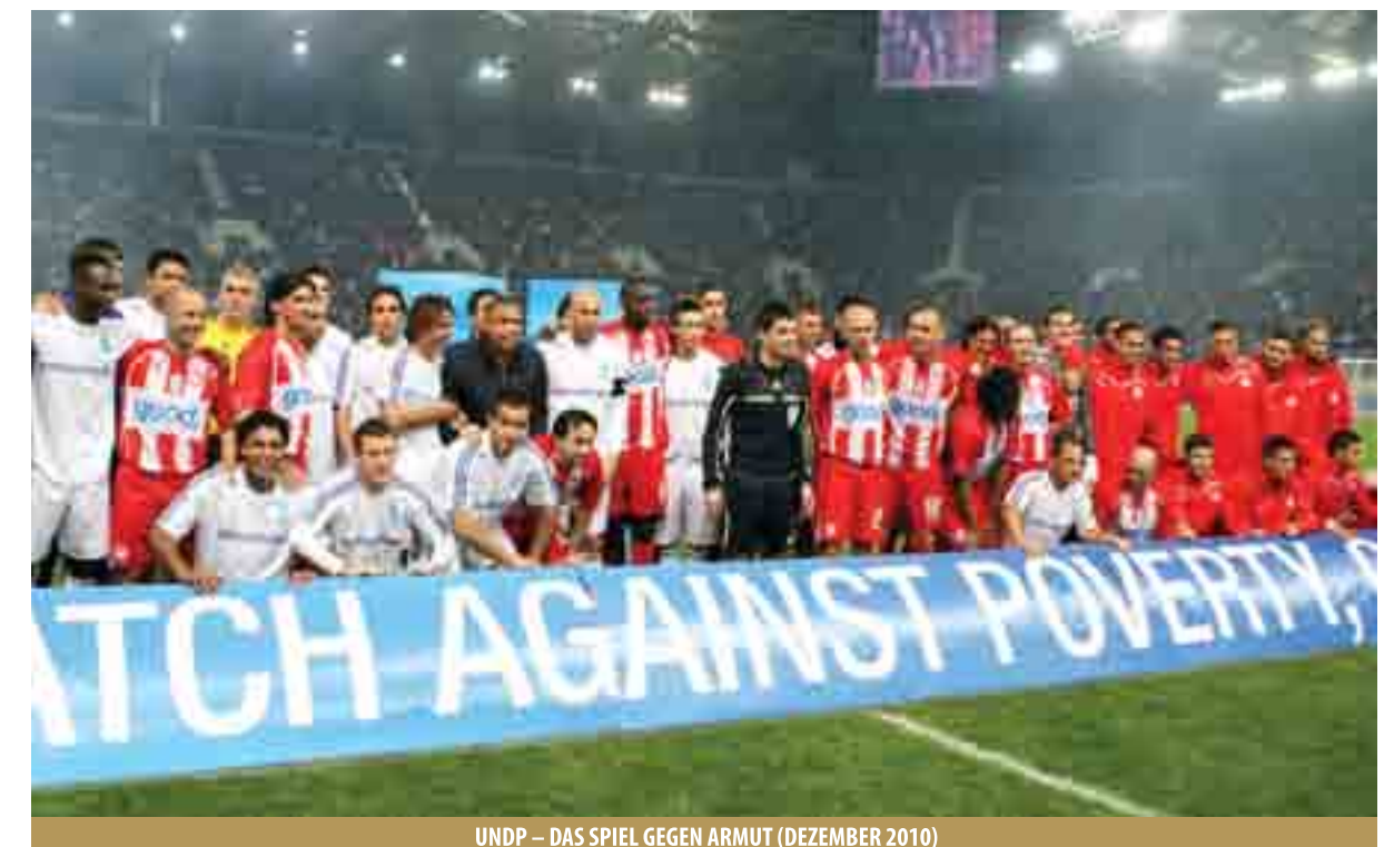
UNDP – DAS SPIEL GEGEN ARMUT (DEZEMBER 2010)