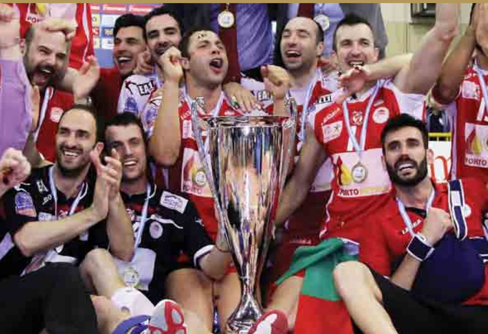
DIE VOLLEYBALL MANNSCHAFT DER HERREN / GRIECHISCHE CHAMPIONS 2013-2014