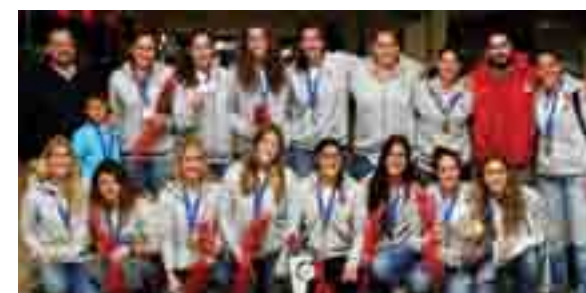
DIE FRAUENMANNSCHAFT WASSERPOLO / EUROPÄISCHER MEISTER (LEN TROPHY) 2014

Das Ziel für das Jahr 2014-2015 von OLYMPIAKOS ist es, sich in allen Disziplinen in Europa zu etablieren. Unser Club ist der einzige in Griechenland der in mehr als einer Sportart Europäische Titel erzielt hat und der bereits die Grundlage für seine Rückkehr an die europäische Spitze gesetzt hat. Im Volleyball hat OLYMPIAKOS 1996 den European Cup und im Jahr 2005 den Top Teams Cup gewonnen, wobei sie im Jahr 2012 im Wasserpolo die Champions League und den Europe's Super Cup gewonnen haben. Die Frauen hingegen haben die Len Trophy im Jahr 2014 gewonnen. OLYMPIAKOS ist auch stolz auf sich den Europäischen Titel im Wrestling gewonnen zu haben, wie auch die drei Europäischen Titel im Basketball in den Jahren 1997, 2012 und 2013.