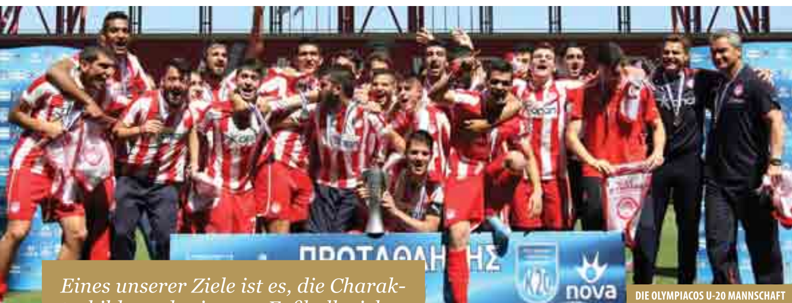
DIE OLYMPIAKOS U-20 MANNSCHAFT

Eines unserer Ziele ist es, die Charakterbildung der jungen Fußballspieler und ihres Wettkampfverhaltens gemäß der Idee des «Fair Play», der Werte des Sports und des Vereins.