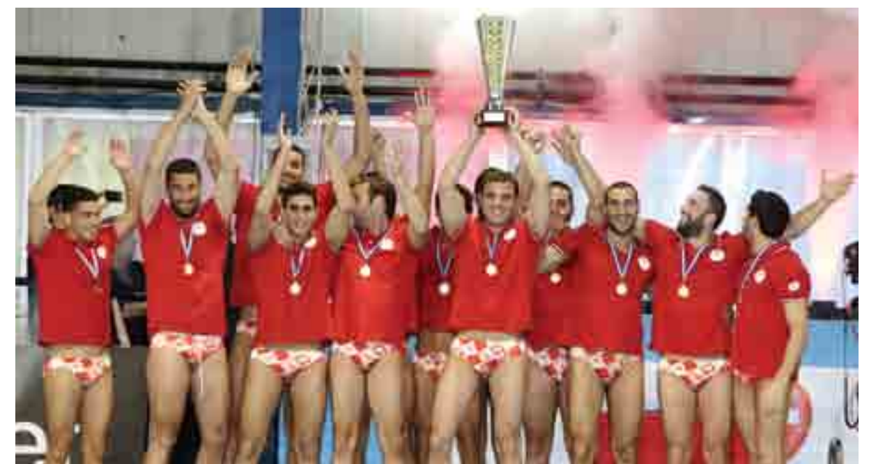
DIE HERRENMANNSCHAFT WASSERPOLO / GRIECHISCHE CHAMPIONS 2013-2014