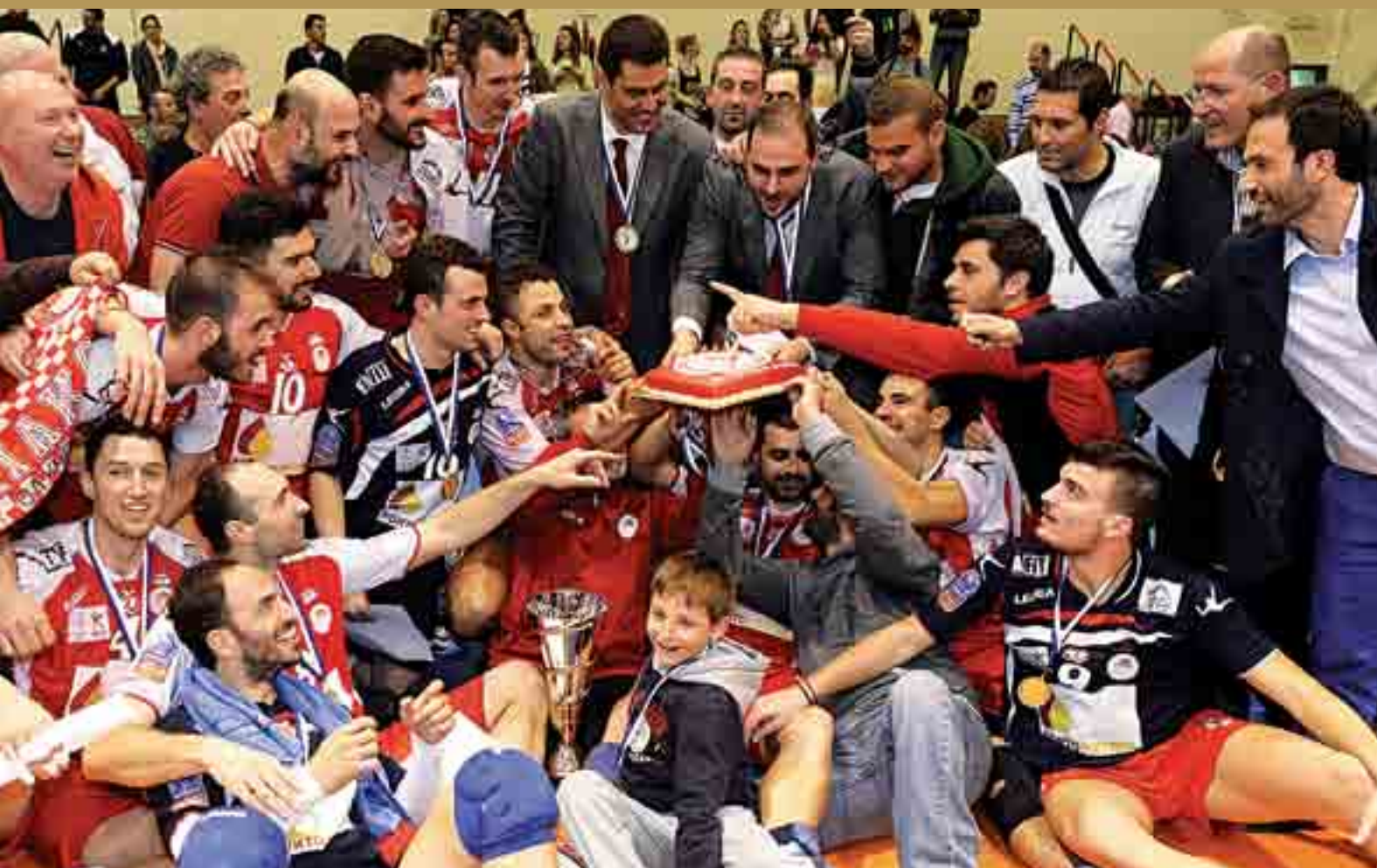
DIE VOLLEYBALL MANNSCHAFT DER HERREN / GRIECHISCHE MEISTERSCHAFT 2013-2014