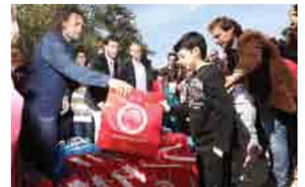
BESUCH IN KEFALONIA