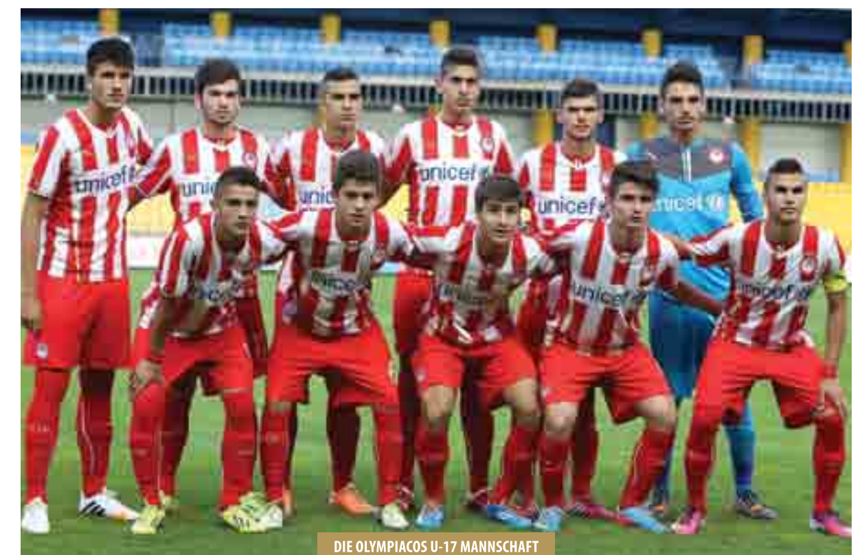
DIE OLYMPIAKOS U-17 MANNSCHAFT

UEFA Youth League-Meisterschaft Superleague U-20 Meisterschaft Superleague U-17 Turnierteilnahme Meisterschaft Superleague U-15 Meisterschaft EPS Piräus, Turnier Meisterschaft EPS Piräus, Turnier Turnierteilnahme Turnierteilnahme Turnierteilnahme Turnierteilnahme