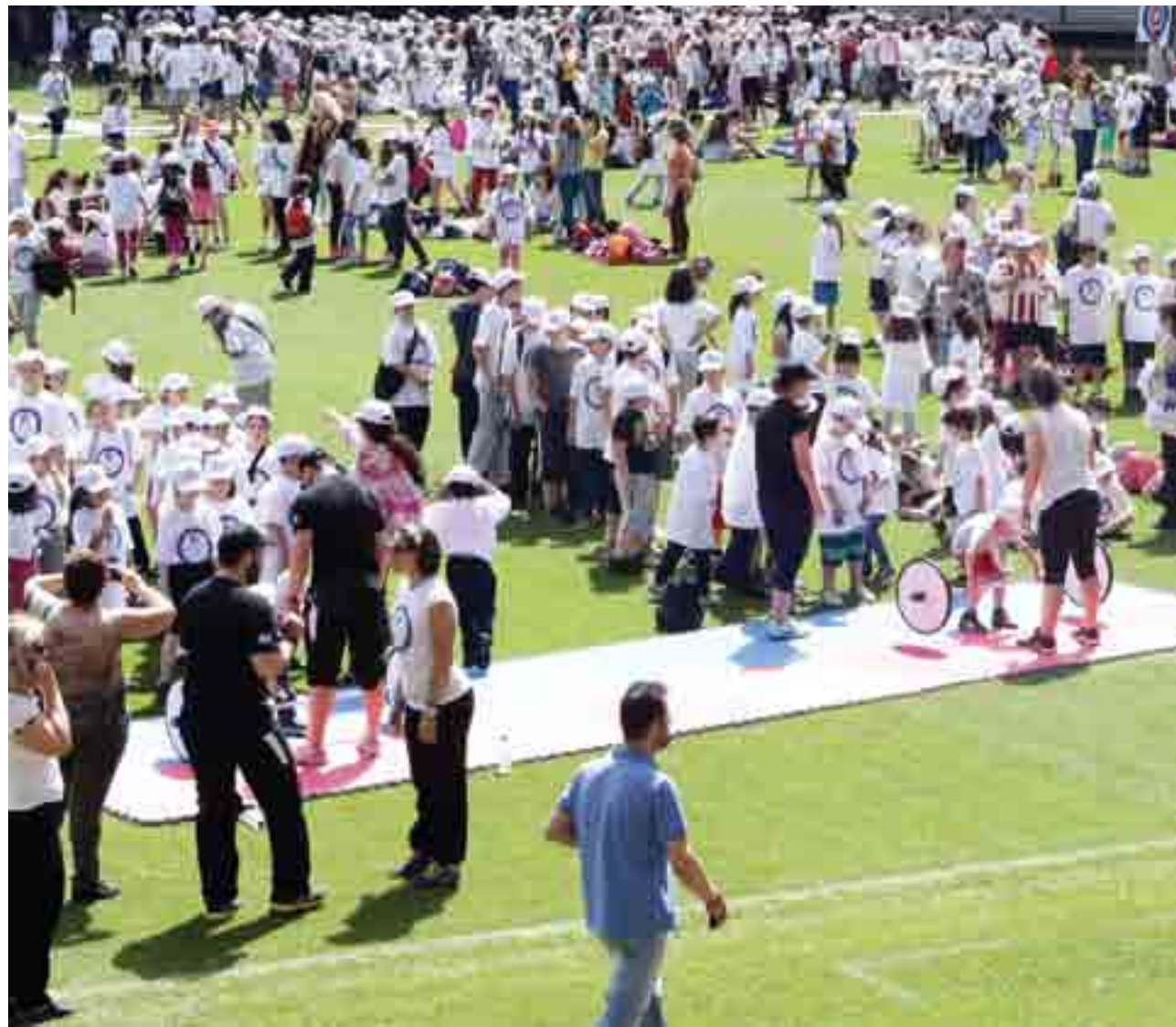
“FAIR PLAY” SEMINAR VON H.O.A. IM “GEORGOS KARAIKAKIS” STADION

der Agentur der UN statt. Die Freunde von Zidane und Ronaldo und weitere Fußballstars trafen sich im Karaiskakis Stadion und spielten ein Spiel, das den Menschen der Hoffnung und eine Wohltat spendete! Denn diese Spiel unterschied sich von den anderen: es war ein Spiel für einen rein sozialen und humanitären Zweck mit dem Ziel, leidenden Menschen in Haiti und Pakistan als auch Notleidenden in Griechenland zu helfen.