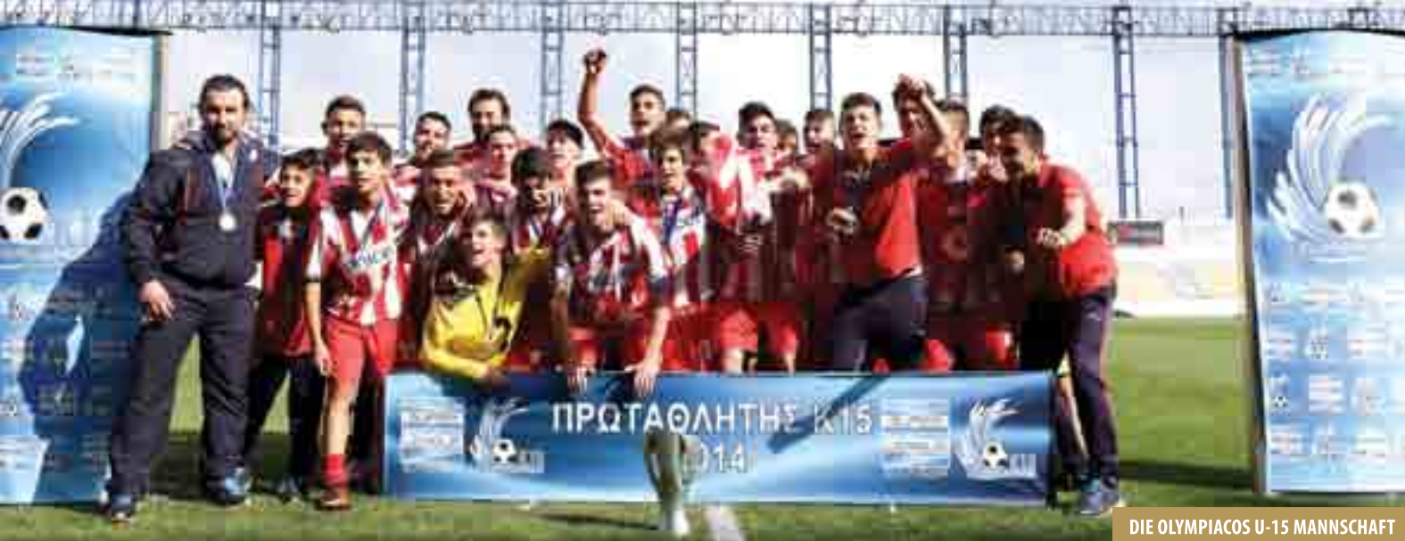
DIE OLYMPIAKOS U-15 MANNSCHAFT