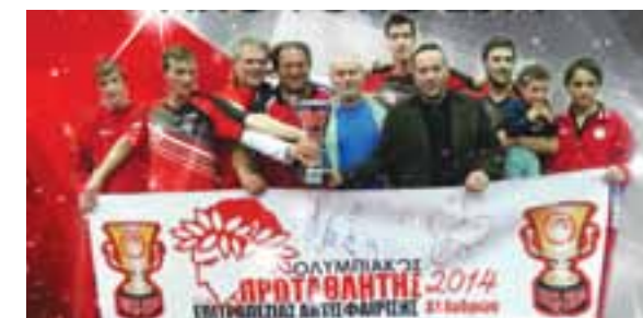
TÊNIS DE MESA MASCULINO / CAMPEÕES GREGOS 2013-2014