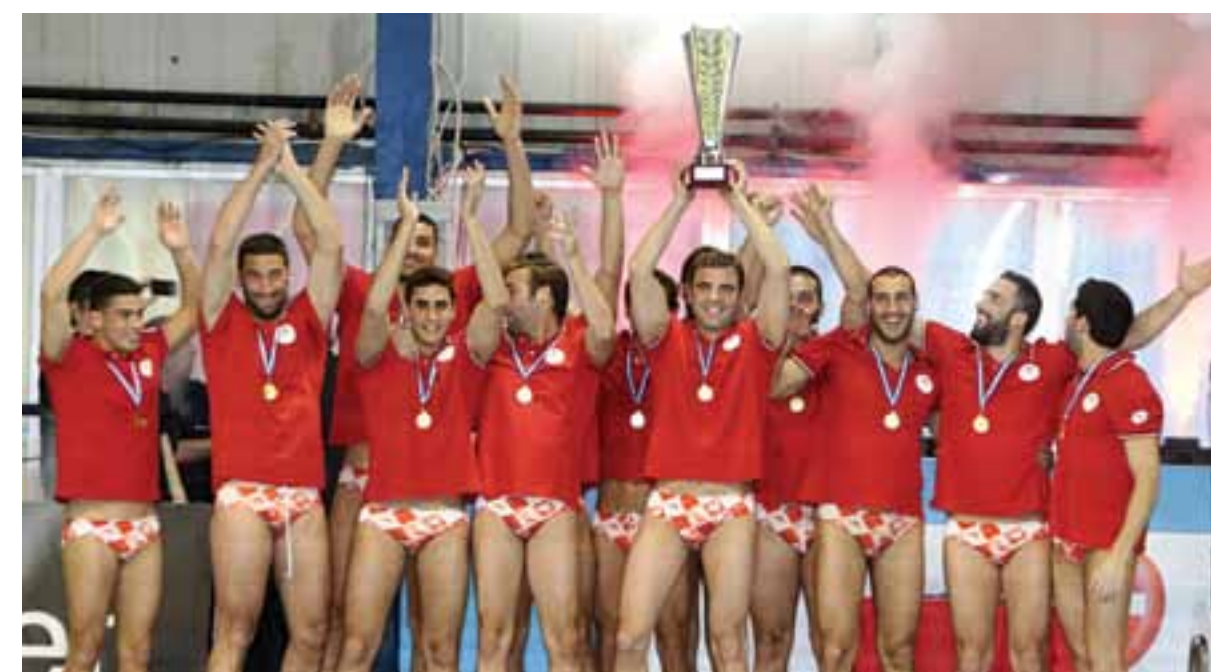
PÓLO AQUÁTICO MASCULINO / CAMPEÕES GREGOS 2013-2014