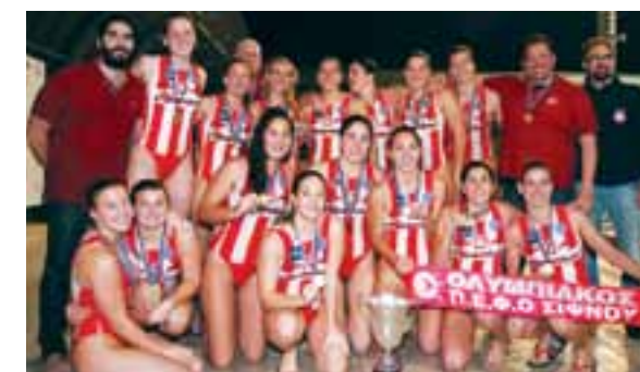
PÓLO AQUÁTICO FEMININO / CAMPEÃS GREGAS 2013-2014