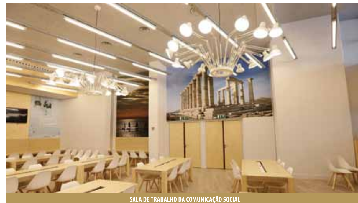
SALA DE TRABALHO DA COMUNICAÇÃO SOCIAL