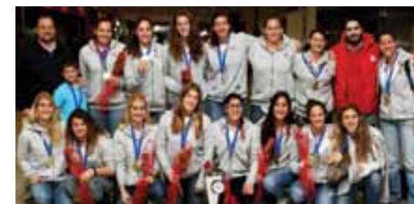
PÓLO AQUÁTICO FEMININO / VENCEDORAS DA COMPETIÇÃO EUROPEIA LEN TROPHY 2014