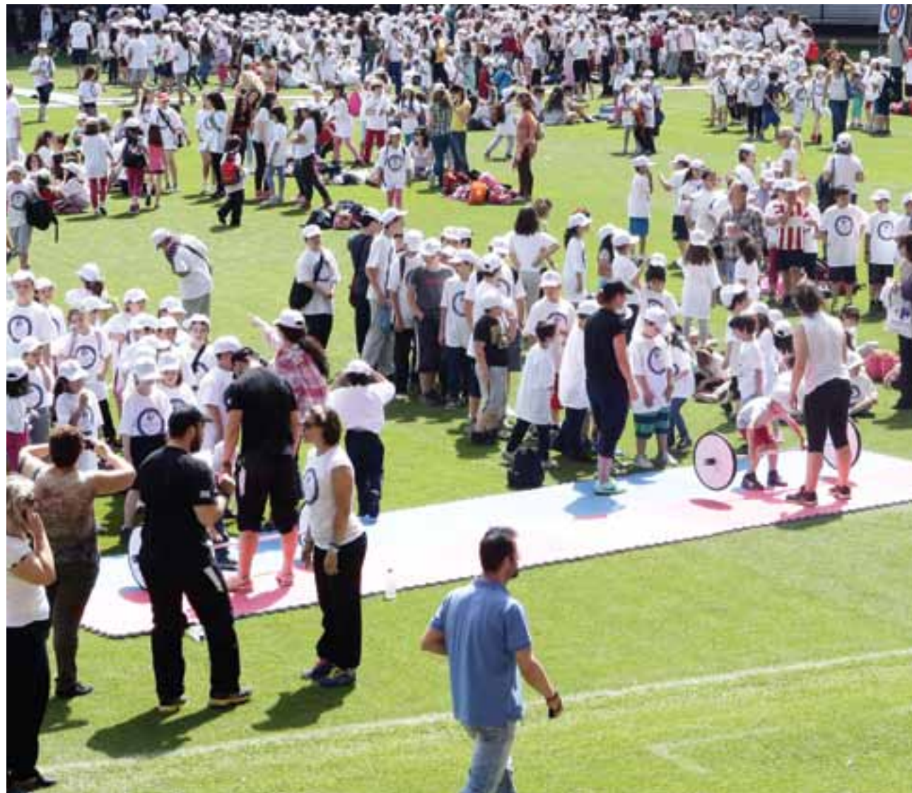
JORNADA «DESPORTIVISMO» DA ACADEMIA OLÍMPICA HELÉNICA NO ESTÁDIO GEORGIOS KARAIKAKIS

De entre as acções que a “Lenda” realizou no passado, destaca-se naturalmente a organização do grande «Jogo Amigável Contra a Pobreza». Um amigável que decorreu a 14 de Dezembro de 2010, em colaboração com o departamento responsável da ONU. No estádio Karaiskakis, os amigos de Zidane e os amigos de Ronaldo, as maiores estrelas do futebol, jogaram pela esperança, pela ajuda ao nosso semelhante e pela beneficência! Um jogo diferente dos outros, com faceta social e fim humanitário, o auxílio às vítimas no Haiti e no Paquistão, mas também aos carenciados na Grécia.