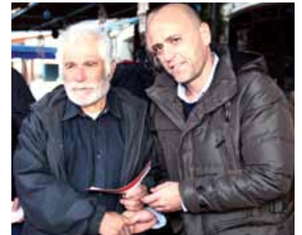
APOIO ÀS VÍTIMAS DAS ILHAS DE PSERIMOS E KALYMNOS

Merece menção especial, naturalmente, o grande amigável com o Liverpool, no Verão de 2013. A “Lenda” esteve presente em Anfield para homenagear Steven Gerrard, o grande capitão do Liverpool, tendo ao mesmo tempo tomado iniciativas no campo da acção social! O Presidente, Sr. Marinakis, doou a quantia de 100.000 libras à Steven Gerrard Foundation e tornou o nome da “Lenda” ainda mais conhecido fora das quatro linhas!