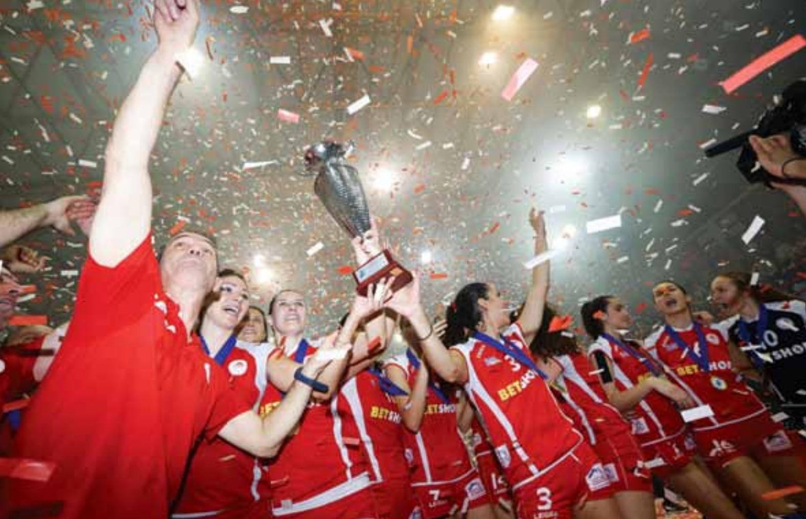
VOLEIBOL FEMININO / CAMPEÃS GREGAS 2013-2014

O OLYMPIACOS mantém Academias em todos os desportos praticados no clube, onde milhares de crianças aprendem com figuras de topo os segredos do desporto. No nosso clube não é dada importância apenas ao progresso na parte estritamente desportiva, mas também ao comportamento dos atletas tanto na sociedade como na escola. O OLYMPIACOS forma os futuros Campeões, mas também cidadãos úteis à sociedade. Todos os anos para esse efeito promove e homenageia as crianças das suas Academias que se distinguiram nos seus estudos.