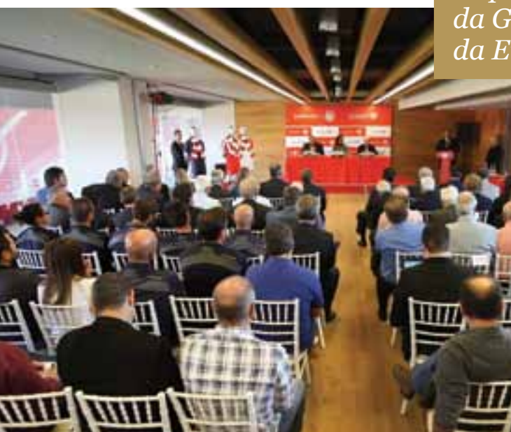
SALA DE EVENTOS V'AMMOS

A casa do Olympiacos tornou-se ainda mais “quente” e “forte” e a equipa dispõe do mais moderno estádio da Grécia e um dos mais modernos da Europa!