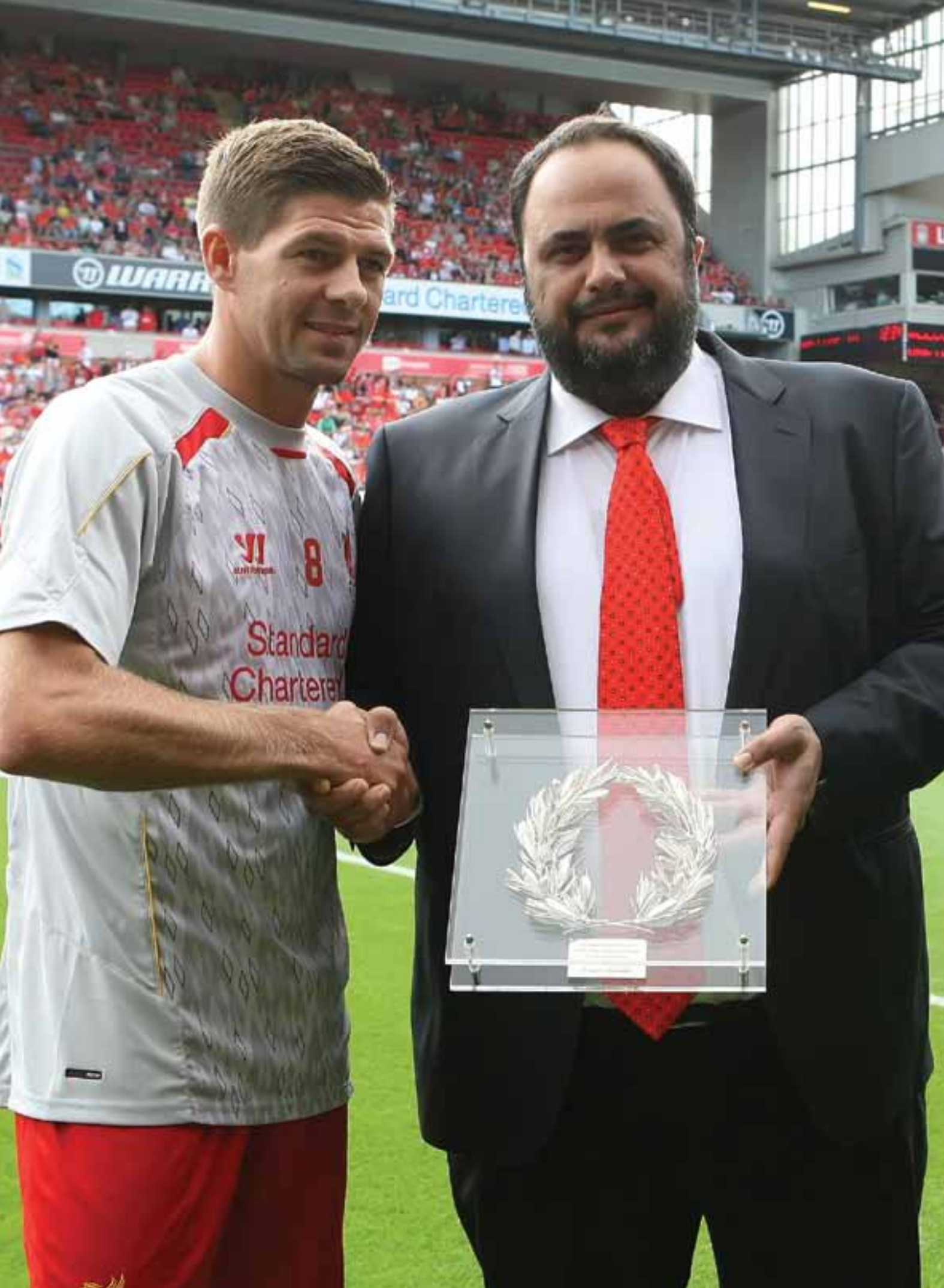
AMIGÁVEL COM O LIVERPOOL EM HOMENAGEM A STEVEN GERRARD (AGOSTO DE 2013)