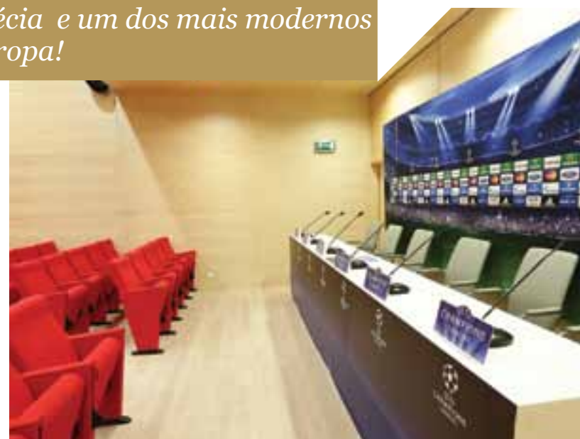
SALA DE CONFERÊNCIAS DE IMPRENSA