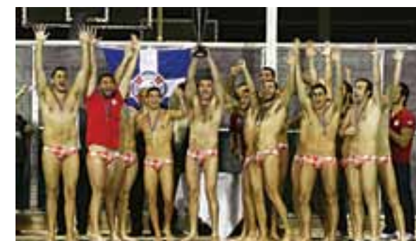
PÓLO AQUÁTICO MASCULINO / VENCEDORES DA TAÇA DA GRÉCIA 2013-2014