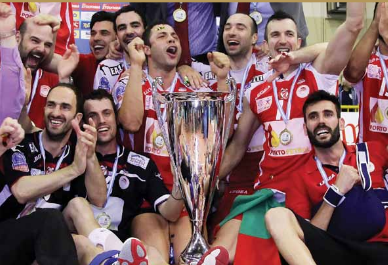
VOLEIBOL MASCULINO / CAMPEÕES GREGOS 2013-2014