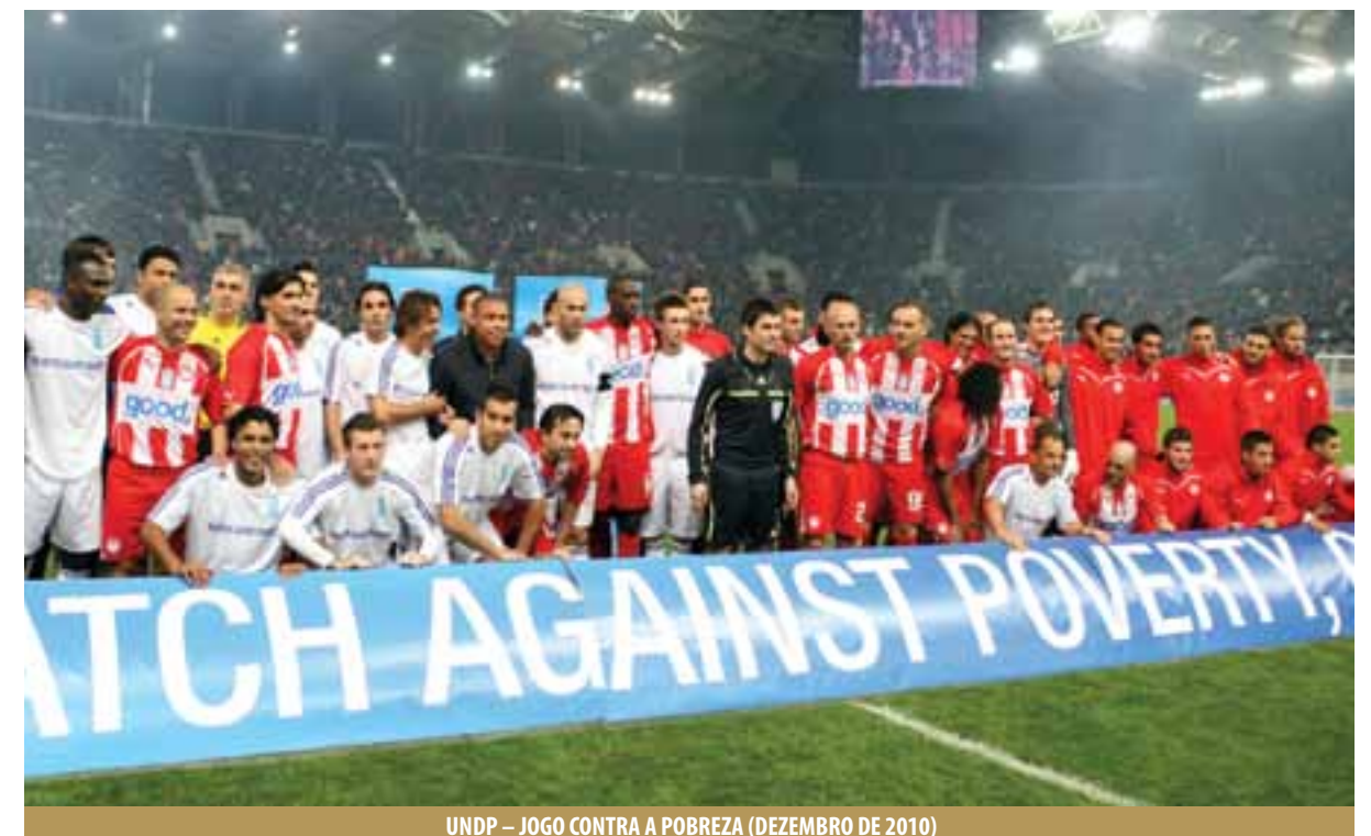
UNDP – JOGO CONTRA A POBREZA (DEZEMBRO DE 2010)