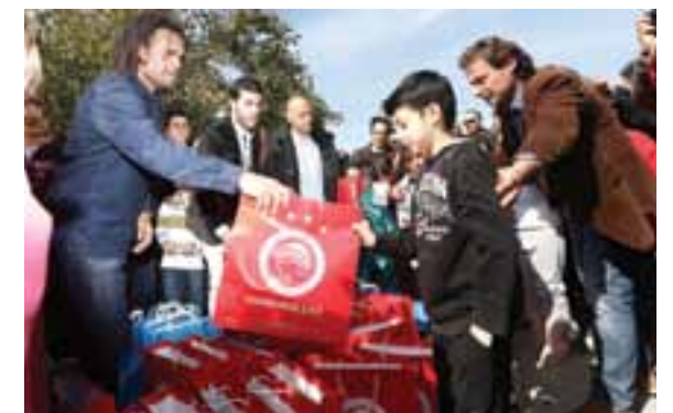
VISITA EM KEFALONIA