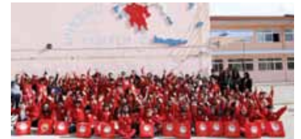
VISITA EM EVROS TICHERO

Mas não são só essas as acções. Diariamente, o Olympiacos e a sua direcção lutam pelo bem dos nossos semelhantes, de forma a que obtenham um presente melhor e um futuro ainda melhor. Durante a sua visita ao Patriarcado Ecuménico, o Presidente do Olympiacos expressou junto de S. Exa. Revma. Bartolomeu o seu cada vez maior desejo de contribuir para a obra levada a cabo pela igreja, de todas as formas possíveis!