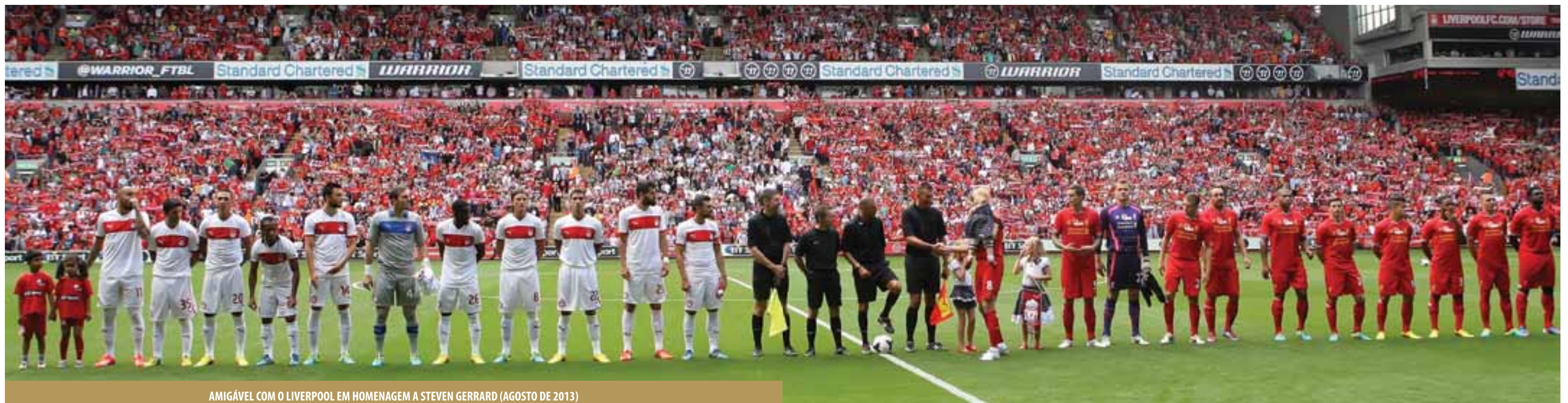
AMIGÁVEL COM O LIVERPOOL EM HOMENAGEM A STEVEN GERRARD (AGOSTO DE 2013)