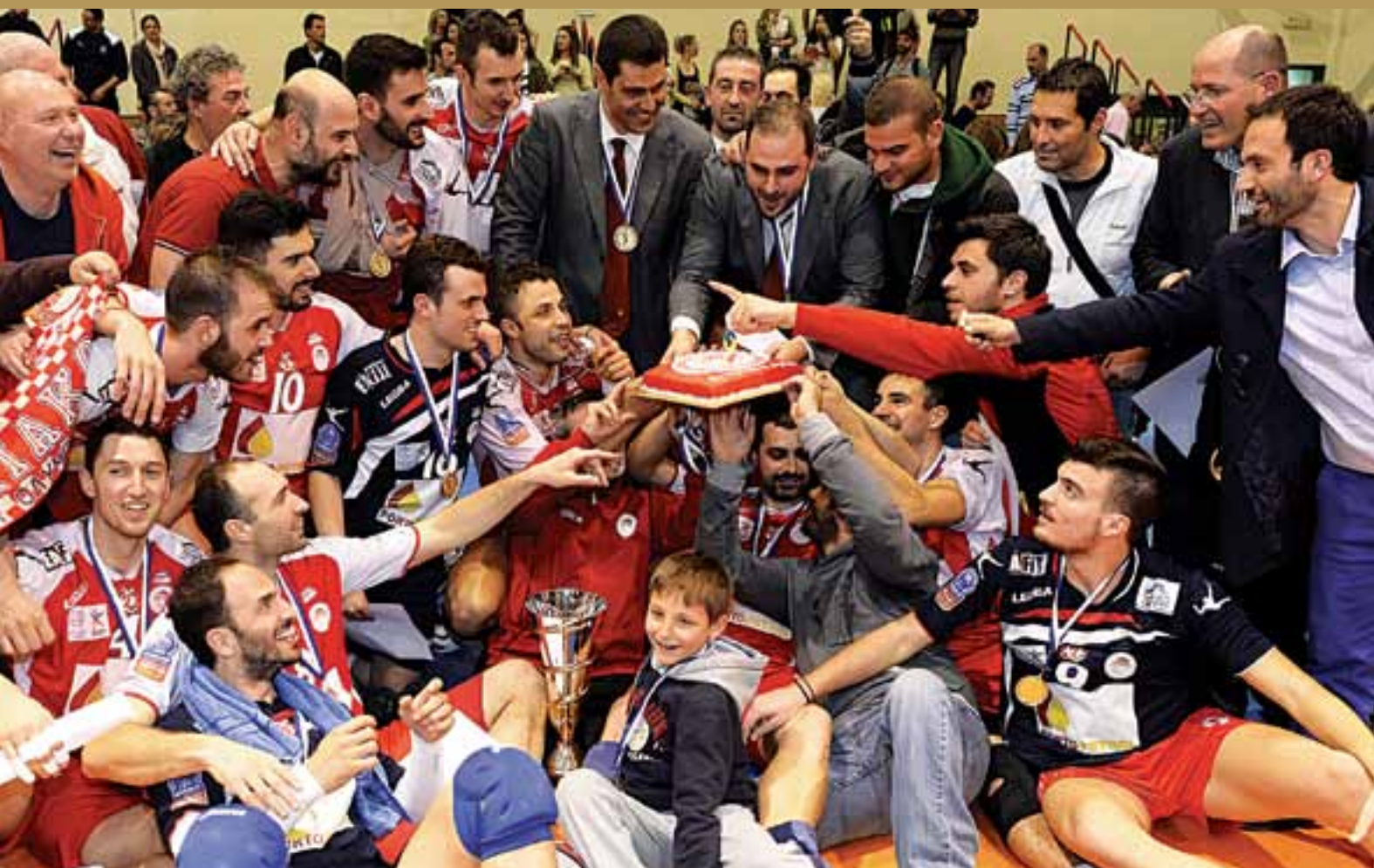
VOLEIBOL MASCULINO / VENCEDORES DA TAÇA DA GRÉCIA 2013-2014